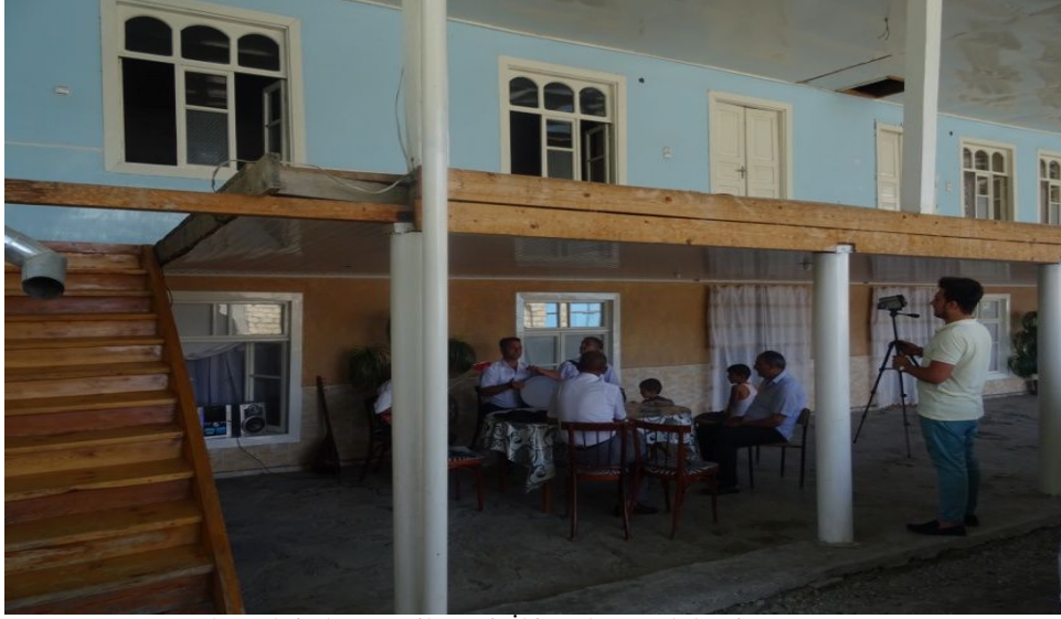
Ağdaş Şehrinde, Karaçilere Ait İki Katlı ve Avlulu Bir Ev

Karaçiler yapılan araştırmalar ve görüşmeler ışığında günümüz Azerbaycan'ında Bakü, Sumqayıt, Berde, Göyçay, Ağsu, Ağdaş, Gence və Xaçmazda şehir ve bölgelerinde, Karaçiler ikamet etsede en çok Karaçi nüfusunun Ağdaş'ta 5.000; Yevlak'ta 4.000, Balaken 'de ise 2.000 civarında olduğu gözlemlenmiştir. Bu bölgelerde yaşamlarını sürdüren Karaçiler tek katlı veya iki katlı avlulu ve oda sayısı çok olan evlerde kalabalık olarak bir arada yaşamaktadırlar.