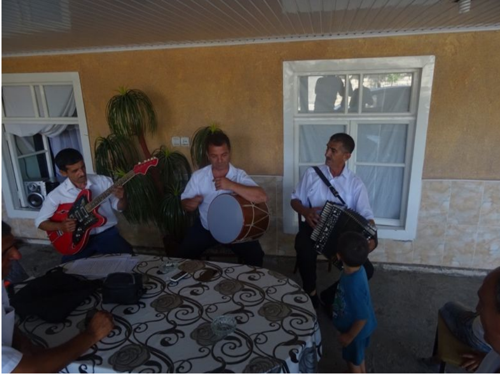
Ağtaş'ta, Karaçilerin Genellikle Düğünlerinde Kullandıkları Çalgılar: Soldan Sağa Elektrogitar, Koşa Nağara, Garmon. Fotoğraf : Zafer KILINÇER 2017

Azerbaycan Karaçi topluluğu müzikle ilgilenenler kırsal bölgelerde yaşamlarını sürdürmektedirler. Bu sebeple müzisyenliği düğün, kına, nişan gibi kutlamaların olduğu özel günlerde meslek olarak yapmaktadırlar. Azerbaycan'da Karaçilerin düğün mekânlarında icra ettikleri müzikler, yoğun olarak Azerbaycan'ın yerel, yöresel ve kültürel özelliklerini yansıtmakla beraber, Karaçilerin kendi üslupsal farklılıklarını da göstermektedir.