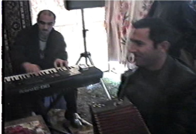
Ağtaş'ta düğün çadırında Org ve Garmon çalan müzisyenler.

Azerbaycan Karaçi topluluğu müzikle ilgilenenler kırsal bölgelerde yaşamlarını sürdürmektedirler. Bu sebeple müzisyenliği düğün, kına, nişan gibi kutlamaların olduğu özel günlerde meslek olarak yapmaktadırlar. Azerbaycan'da Karaçilerin düğün mekânlarında icra ettikleri müzikler, yoğun olarak Azerbaycan'ın yerel, yöresel ve kültürel özelliklerini yansıtmakla beraber, Karaçilerin kendi üslupsal farklılıklarını da göstermektedir.