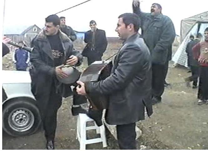
Yevlakta Dügün Evi Önünde Darbuka, Garmon ve Klarnet Çalan Müzisyenler Yevlak'ta Karaçi düğününde Klarnet, Garmon, Darbuka ile gelin almaya giden Karaçi müzisyenler