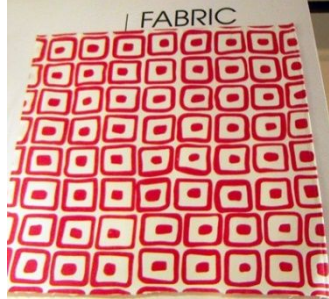
Şekil 4: Laura ve Bernard Ashley'in Pimlico'da ilk kez mutfak masalarında bastıkları el yapımı orijinal fular, kırmızı geometrik karelere sahip. ( https://printpattern.blogspot.com/2013/06/laura-ashley-aw13-press-show-pt1.html , erişim tarihi: 23.01.2019)

İlk başta, Pimlico'daki küçük dairelerinde mutfak masalarında geometrik desenlere sahip küçük bir eşarp bastılar. Bu süre zarfında "Roma Tatili" filmi vizyona girmişti ve filmdeki Audrey Hepburn'ün eşarbu, 1952'de genç İtalyan kızların arasında moda olmuştu. Kısa bir süre içinde John Lewis ve Heal's gibi dükkânlara çok miktarda baskılı küçük tekstiller satmaya başlamışlardı.