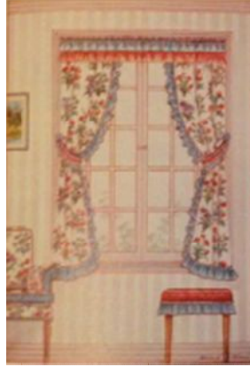
Şekil 18: 1920'lerin ve 30'ların 'yeni fakir' kır evi için "basit ama akıllı" bir şema. "İngiliz ve Amerikan Tekstillerinden: 1790'dan Günümüze (From English and American Textiles: From 1790 to the Present), M. Schoeser & C. Rufey, 1989, s. 173. (Thoreson, 2016, 33).

Ashley, her şeyden önce ev için tasarladı, kadınların gerçek gereksinimlerine hizmet etti, ancak kırsal-sempatik estetiği, çiçekli tasarımları ile en başından beri, tasarımları geçmişe kök salmıştı.