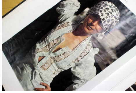
Şekil 19: Yetmişlerde, Laura Ashley Meksika'dan ilham alan bir moda ile tasarımlarına başka bir özellik kazandırdı ve çekim için gece boyunca hafifçe kıskırtıcı bir broderie anglaise bluzu seçti. (Sunday Times Style) B49 bluzu olarak bilinen bu bluz, en çok satanlarından biri oldu. ( http://stylebubble.co.uk/style_bubble/2013/02/laura-ashley-uncovered.html , erişim tarihi: 24.01.2019)

Laura Ashley, İngiliz kadınlarına 70'lerin başında istediklerini nasıl verdi? Adeta, Quant'ın 60'ların Youthquake (gençlik depremi) minisine tehdit edici olmayan bir cevaptır. Mini, kullanıcıyı biraz çatışmacı ve keskin olmaya zorlarken, Laura Ashley'in katlı, büzgülü, kabarık ve kapalı stilleri, kadınları "yumuşak başlı kadınlık" olarak tanımladığı şekilde biçimlendirmişti (Daily Mirror, 1 Ocak 1970). Kadınlar ne istemişlerdi? Hayalperest, sağlıklı, romantik bir aşk istediler. Hepsinden önemlisi, rahat ve utanmadan "kadınsı" hissetmek. Laura Ashley tüm bunları, onlara mutlu bir şekilde verdi. Laura'nın tarzları yorumlaması çok ilginçti: daha önceki tarzları kopyalayamıyordu, ancak sanki giyilebilir elbiseler yapmak için ödünç almıştı.