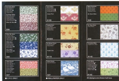
Şekil 6: Laura Ashley duvar kağıdı kartelası ( http://blog.lauraashleyusa.com/wallpaper-everything-you-need-to-know/ , erişim tarihi: 23.01.2019)

Markanın klasik kumaşlarından ve duvar kağıtlarından esinlenilerek üretilen tasarımları, çağdaş, ancak son derece sofistikedir ( https://www.whsmith.co.uk/brands/laura-ashley#lauraashleyhistory , erişim tarihi: 22.01.2019).