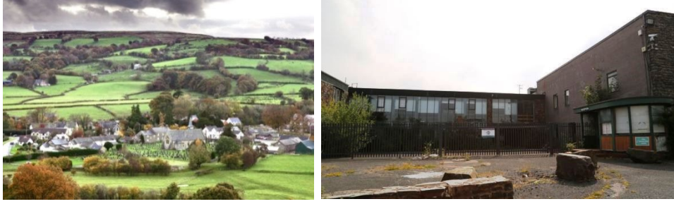
Şekil 12: Ashley Çiftinin taşındığı Carno köyü ve 2005 yılında kapanan Carno'daki fabrika (Galler) ( https://www.walesonline.co.uk/business/business-news/gallery/laura-ashley-story-in-pictures-8669717 , erişim tarihi: 22.01.2019), ( https://www.bbc.com/news/uk-wales-34290383 , erişim tarihi: 22.01.2019)