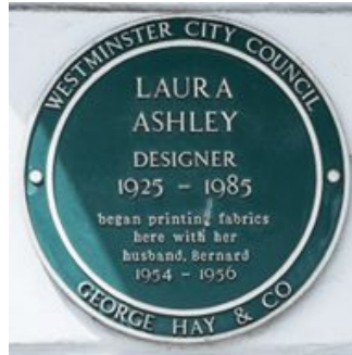
Şekil 5: Pimlico, Cambridge Caddesi'ndeki Laura Ashley plaketi ( https://www.whsmith.co.uk/brands/laura-ashley#lauraashleyhistory , erişim tarihi: 22.01.2019)