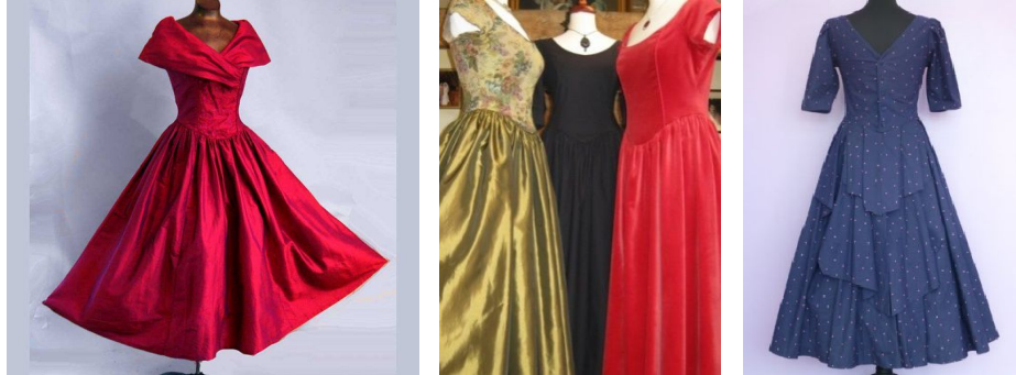
Şekil 16: Laura Ashley elbisesi, 1980'lerin tarzı ( https://www.blue17.co.uk/vintage-blog/80s-vintage-dresses-laura-ashley/ , erişim tarihi: 24.01.2019), ( https://tr.pinterest.com/pin/403564816580302362/ , erişim tarihi: 24.01.2019)