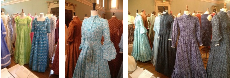
Şekil 20: Regency tarzı dantelalar, mürebbiye tarzı elbise ve yüksek boyun ve fırfırlar, ( http://scrapiana.com/2013/08/13/laura-ashley-the-romantic-heroine/ , erişim tarihi: 24.01.2019)

Tamamen farklı bir şirket haline gelen markanın günümüzdeki durumu ise, sadece Laura Ashley ismi yazmakta. Mağazaların hepsi farklı. Ancak bu yetenekli ve kararlı kadının ruhu, Galler'deki kırsal toplulukları güçlendirmeye yönelik projeleri destekleyen Ashley Aile Vakfı'nda yaşamaktadır.