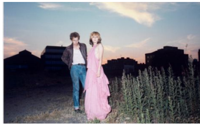
Şekil 14: 1976, The Clash isimli müzik topluluğunun solisti Paul Simonon ve Viv Albertine'in düetinin fotoğrafını çekti.