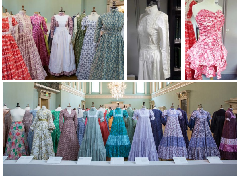
Şekil 10: Romantik kahraman Laura Ashley elbiseleri ( https://www.fashionmuseum.co.uk/laura-ashley , erişim tarihi: 22.01.2019), ( http://stylebubble.co.uk/style_bubble/2013/02/laura-ashley-uncovered.html , erişim tarihi: 24.01.2019)