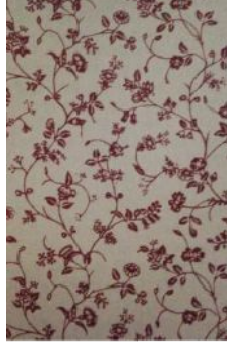
Şekil 21: Ashley, L. (1975). Yabani Sarmaşık isimli tekstil. "Yirminci Yüzyıl Desen Tasarımından: Tekstil ve Duvar Kâğıdı Öncüleri", L. Jackson, 2002, s. 185. (Thoreson, 2016, 23).

Üçüncü neden ise, tanıdık bir nakarata anımsatıyor. 1970'lerin tartışmasında görüldüğü gibi, ekonomik durgunluk, petrol krizi ve başarısız endüstri, kırsalcılığa yönelmeye neden oldu. Sparke'a göre; "1970'lerin başında, İngiliz toplumu, 1940'lı, 50'li ve 60'lı yılların daha iyimser iklimi sırasında, güvenliğini, evde olduğundan daha az hissetmeye başladı ve geçmişe ani bir geri dönüş yaşadı". Bu dönüşün sonucu, bir tasarım durgunluk dönemi değildi, fakat halkın modernite ile olan ilişkisinde onarılamaz bir değişiklik oldu. Sparke, savaş sonrası İngiliz iç mekanlarını karakterize eden "gelenek ve modernite arasındaki ince dengenin" daha bariz bir gelenekçilik lehine kaybedildiğini açıklamaktadır (Sparke, 2012, 120-137).