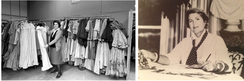
Şekil 2: Tasarımcı, 1976'da çekilen “Yükseliş ve Laura Ashley'in Yükselişi” isimli belgeselde ticari marka değeri olan giysilerini gösteriyor. ( https://www.theguardian.com/business/2018/sep/16/how-laura-ashley-florals-and-frills-define-an-era , erişim tarihi: 15.01.2019)

Laura Ashley romantik kumaşlar üzerine ticari bir imparatorluk kurmuştur ve akıllıca tasarlanmış “geleneksel” İngiliz giysilerinden oluşan bir çizgi yaratmıştır. Çiçek baskılı, kabarık kollu ve fiyonk görüntüleri, adeta İngiliz kadınlarının değişen moda isteklerini gösteren tasarım ve desenlerin bir özetidir.