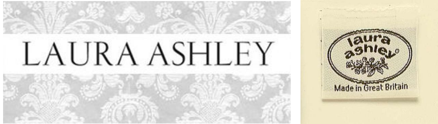
Şekil 8: Laura Ashley marka etiketi ( https://www.whsmith.co.uk/brands/laura-ashley#lauraashleyhistory , erişim tarihi: 22.01.2019), ( http://fashioninstitute.canalblog.com/archives/2011/03/10/20593454.html , erişim tarihi: 23.01.2019)

Laura Ashley öldü ama adı hala sürmekte. Onun dediği gibi; "Geçici şeyleri sevmiyorum; Sonsuza dek sürecek olan şeyleri severim."