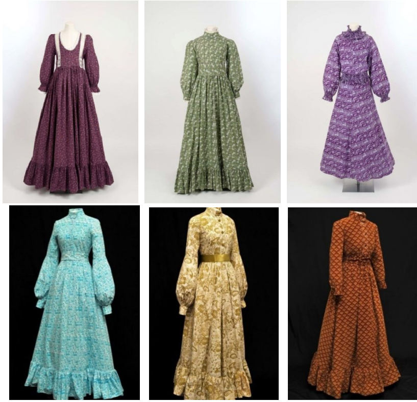
Şekil 15: Laura Ashley, (1974) Laura Ashley pamuklu, çiçek desenli, "Karanfil" (solda), 1973 veya 1974'ten pamuklu çiçek desenli bir elbise (ortada), av köpeği ve geyik desenli (1972) tasarımı uzun pamuklu bir elbise (sağda). ( https://www.nytimes.com/2013/07/11/fashion/a-look-back-at-the-romance-of-laura-ashley.html , erişim tarihi: 24.01.2019), Bowes Müzesi'nde sergilenen elbiseleri (altta) ( https://wsimag.com/art/4657-laura-ashley-the-romantic-heroine , erişim tarihi: 24.01.2019)