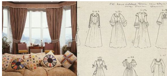
Şekil 3: 1970'lerde, şirket küresel olarak genişlemeye başladı ve 1977'de Kraliçe'nin İhracat Ödülü'nü kazandı ve ciro 1979'da 25 milyon £'a ulaştı. ( https://www.dailymail.co.uk/femail/article-2300629/Classic-English-brand-Laura-Ashley-plans-mega-makeover-announces-sales-slump-years.html , erişim tarihi: 22.01.2019)

Laura Ashley tasarım şirketi, bir ülke yaşamı idealini modern müşterilere pazarlayan ilk ticari ana cadde zinciriydi. 1970'lerde, Ashley'in ticari markası olan dökümlü çiçekli kadın giysileri, kentin karmaşıklığını reddetmek için sanki bir hippie dürtüsüyle doluydu.