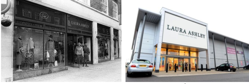
Şekil 7: Laura Ashley Eylül 1985 yılında Londra Knightsbridge'deki dükkânları ve İngiltere genelinde 200'den fazla mağazası bulunan ticari bir marka ( https://www.walesonline.co.uk/business/business-news/gallery/laura-ashley-story-in-pictures-8669717 , erişim tarihi: 22.01.2019)

Şirketin Newtown, Powys'deki fabrikasında yapılan ev eşyaları, duvar kâğıtları ve boyaları, Malezyalı sahiplerinin 1998'de şirketi devralmasından bu yana şirketin merkezi haline gelmiş ve satışlarının %80'ini oluşturmaktadır.