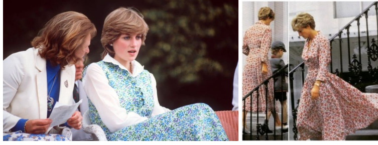
Şekil 9: Prenses Diana'nın Laura Ashley giysilerine olan sevgisi, bir nesil üst sınıf genç ve şık kadınların (Sloane Ranger) kendileri için giysileri satın almalarına esin kaynağı olmuştur. ( https://www.theguardian.com/business/2018/sep/16/how-laura-ashley-florals-and-frills-define-an-era , erişim tarihi: 15.01.2019)