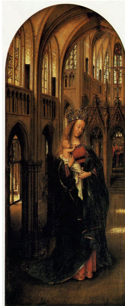
Resim 3. Jan Van Eyck, "Kilise'deki Hz. Meryem", meşe üzerine yağlı boya, 31x14 cm, 1438.

Bebek İsa yine annesinin göğsünden süt emerken resmedilmiştir fakat bu tabloda annenin göğsü çocuğun eli ile kapatılmış, sadece küçük bir kısmı cinselliği çağrıştırmayacak şekilde görünmektedir. Cinsellik anne arketipinin birincil özelliklerinden değildir. Klasik bir anne figürü olarak çokça Meryem'in tasvir edilmesi de bu yüzdendir: Meryem, cinsellik olmadan İsa'ya hamile kalmış ve saflığı bozulmamıştır. Kısmen açık göğüs ise, bu fikri vermekten çok uzakta olup, sadece bebeğin beslenmesi, ona hayat vermesini sağlayan bir obje olarak görülür. Cinselliğin bir diğer reddi ise Meryem'in giyiminden ileri gelir: yakası az miktarda açık bir bluz ve üstüne bir hırka giymiştir ve saçlarının bir kısmını da bir eşarp ile kapatarak muhafazakar bir görüntü oluşturmuştur. Da Vinci'nin kullandığı kırmızı ve mavi renkler yine döneminin soyluluğu çağrıştıran renkleridir; Meryem'e sadece İsa'yı doğurduğu için değil, anne olduğu için de bir kutsallık bahşedilir.