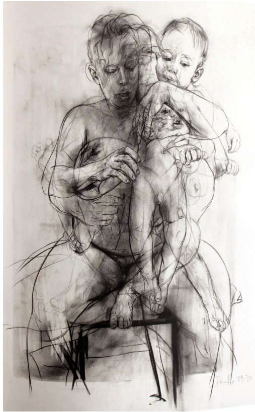
Resim 9. Jenny Saville, "Mothers", 2011.

Paula Modersohn-Becker'in 1900ler başında resmettiği anne ve çocuk resminde (Resim 8) anne tamamen çıplaktır. Çocuk arketipi, özellikle de halen beslenme için anne sütüne muhtaç olduğu bir safhadayken, muhtaç yeni doğan halini yansıtmak, ve saflığın ve masumiyetin sembolü olduğunu göstermek adına çoğunlukla çıplak tasvir edilir veya beyaz kumaşlar giydirilmiş haldedir. Modersohn-Becker'in resminde tipik bir çocuk görürken, daha alışılmışın dışına çıkan bir anne arketipi de görürüz. Çıplaklık normalde cinselliği çağrıştırmamasından dolayı ve Orta Çağ'da anneyi bu tür bir çağrışımdan uzak tutmak ve iffetini korumak adına, Meryemler ağır giysiler altında ve emziriyor olsa bile çocuğun eli göğsü kapatır şekilde tasvir edilmişlerdi. Fakat yakın zamanlardaki resim hareketlerine ve özgürleşmiş biçemlere baktığımız zaman, her ne kadar anne belli bir çıplaklık ile tasvir edilse de, tasvir biçimi anneyi bu olgudan uzaklaştırır. Modersohn-Becker, uyuyan anne ve çocuğu birbirine yakın ve sarmış, anneyi korumacılık içgüdüsü ile çocuğuna adeta kol kanat germiş olarak tasvir etmiştir. Annenin genital organının kısmen görülmesi onu dünyevi ve sıradan annelerin arasına katmış olmasına rağmen buldukları uzam - beyaz örtüler üzerine - ve her ikisinin de adeta savunmasız bir şekilde cenin pozisyonunda, yüzleri birbirlerine dönük şekilde yatmaları bu anne ve oğla yine de ulvi bir alt metin de yüklemiştir.