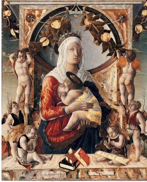
Resim 1. Anonim, Orta Çağ.

Orta Çağ'da anonim olarak resmedilmiş bu Meryem ve Küçük İsa resminde (Resim 1) görülen anne, kutsal formlar ve semboller zenginliği içerisinde resmedilmiştir. Anne yorgun ve mağrur bakış ifadesi ile kutsal denilebilecek bir ifade ile bize bakar. Küçük İsa sıradan diğer bebekler gibi annenin çıplak göğsünden süt emmektedir. Görülen bu resim özellikle dönemin karanlığı göz önünde bulundurulsa bile bu çıplaklık ve kadının yüzündeki güçlü ifade cinsellik ile yan yana konamamaktadır. Jung'ın anne arketipinin klasik özelliklerini taşıyan bu tabloda alt metine ayrıca katkıda bulunan elementler vardır: annenin önünde üst üste konulmuş kitaplar, Hıristiyan inancına bir referans olsalar da, arketipin bağlamına da anneyi bilgeliğin sahibi olan birey olarak portreleyip katkıda bulunurlar. Çocuğunu - özellikle de ilk olanını - yetiştirmek, bir kadının tecrübesiz olmasına rağmen içgüdülerini dinlediğinde ve çocuğunun sağlığını ve güçlenmesini istediğinde doğal olarak çocuğunu yetiştirmek için yollar bulacaktır. Arketipin tipik özelliklerinden biri olan çocuğu koruma içgüdüğü de tabloda kitapların bilgeliği üzerinden portrelenmiştir.