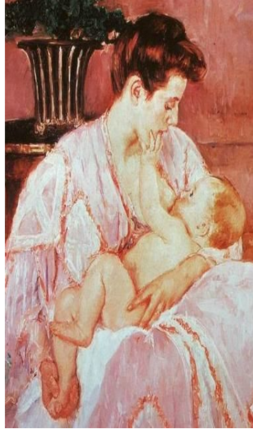
Resim 5. Mary Cassatt, "Mother Nursing her Child", 1906.

tablodaki odak noktası anne ve çocuk arasındaki güçlü bağ ve anne arketipinin dominant ve koruyucu/kollayıcı olarak tasvir edilmesi olmuştur.