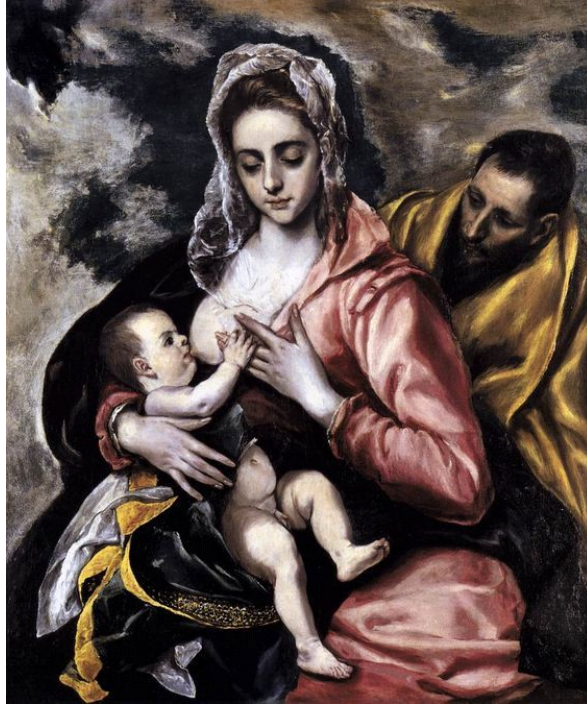
Resim 4. El Greco, "The Holy Family", 1585 civarı.

Pencerelerden sızan büyüü ışık Meryem'in bekaretini ve tazeliğini simgeler. Anne, çocuk doğumu gibi zor ve yıpratıcı bir süreçten geçmesine karşın halen bir genç kıızı andırmaktadır. Kadının biyolojik yıpranması gözükmemektedir. Meryem güzel bir kadın olarak resmedilmiştir. Bu noktada denilebilir ki, resim daha çok kadının anne olarak resmidir: Anne öne çıkış ve kutsallaştırılmıştır.