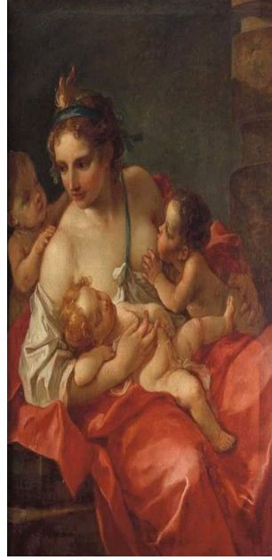
Resim 6. Charles Joseph Natoire, "La Charité", tuval üzerine yağlı boya, 116x86 cm, 1765.

Rokoko dönemden bir ressam olan Charles Joseph Natoire'ın bu tablosunda (Resim 6) bir anne ve çocukların resmedilişini görmekteyiz. Ortadaki kadın formu, biçimi ve duruşu itibarıyla kadınsı bir çekicilikte resmedilmiştir. Fakat yanındaki küçük çocuklar ile birlikte betimlendiğinde dişiliği daha şefkat içeren bir biçime dönüşür. Annenin arkasındaki bebek Yunan mitolojisindeki Eros'a bir gönderme olabilir. Eros, Yunan Mitolojisi'nde aşkı ve sevgiyi temsil eder. Rokoko dönemin süslemeci tavrının içinde, annelik duygusunun resmedilişine katkıda bulunmak için böyle bir göndermeye gerek duymuş olabilir. Anne arketipi korumacı, dişil, şefkatli ve bereket içeren bir modeldir. Orta Çağ'da sıklıkla anne arketipinin bir portresi olan Meryem'in zıddına burada bu ulvi kimlikten sıyrılmış, sıradan insanların arasından gelen bir kadın formu görürüz. Form değişse de anne arketipi görülmektedir fakat sıradan bir kadının resmedilişi, anne arketipinin evrenselliğine vurgu yapar. Resimdeki anne, artık Meryem gibi muhafazakarlığı göz önünde bulundurma çabasından uzaktadır ve bunu ağır bir şekilde giydirilmemesinden anlayabiliriz. Orta Çağ Meryem betimlemelerinin aksine, ev işleri gibi dünyevi şeylerle uğraşısının bir yansıması olarak giysisi özensiz ve saçları dağınıktır fakat yüzündeki dingin ifade ve pembe yanakları anneliğinden ne derece mutluluk aldığını gösterir. Kadının çıplak betimlenmiş göğüsleri ve beyaz teni, annenin dokunulabilir ve sevgi dolu bir canlı olduğunu da söylemektedir.