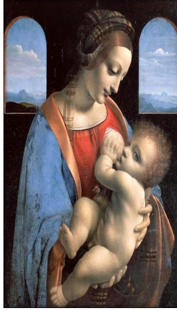
Resim 2. Leonardo da Vinci, "Madonna Litta", 1485 civarı.

Leonardo'nun "Madonna Litta" (Resim 2) adlı tablosunda annenin çocuk İsa'ya bakıyor olduğunu görürüz. Çocuğa bakışı anne arketipini daha da güçlendiren bir tavidir. Da Vinci'nin bu resminde anne (Meryem) çocuğa şefkat duygusu içinde bakarken, bebek İsa izleyici ile göz teması kurmaktadır. Ulvileşen anne sanki başka bir boyuttaymış gibi resmedilmiştir. Annenin çocuğa bakışı anne arketipini daha da güçlendiren bir tavidir. Aralarındaki iletişim İsa'yı daha dünyevi kılarken anneyi kutsal bir yere yerleştirmiştir.