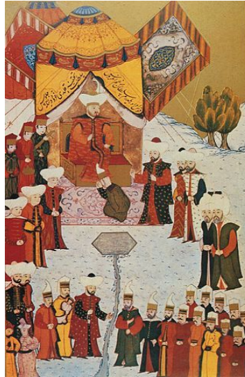
Resim 2: Yıldırım Beyazid'in Cülüsü, Hünernâme I, Seyyid Lokman, 1579-1584

Minyatür İncelemesi: Topkapı Sarayı müze kütüphanesinde (H. 152 y. 96b.) envanterinde yer almaktadır. Minyatür Yıldırım Beyazid'in babası I. Murad'ın Kosova Savaşı sonunda bir Sırp askeri tarafından şehit edilmesi sonrası 1389 yılında taht'a çıkışını tasvir etmektedir.