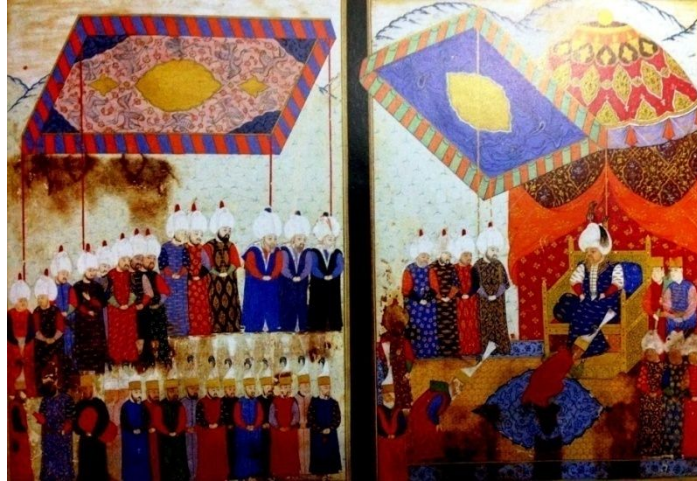
Resim 3: Sultan II. Selim'in Belgrad'ta Cülüsü, Nüzhetü'l-esrârî'l-ahbâr der Sefer-i Sigetvar, Feridun Ahmed Bey, 1568

Minyatür İncelemesi : Topkapı Sarayı müze kütüphanesinde (H.1339, y. 110b. -111a.) envanterinde yer almaktadır. Minyatür Kanuni Sultan Süleyman vefat ettikten sonra oğlu Şehzade Selim'in 1566 yılında taht'a çıkışını tasvir etmektedir (Tarım Ertuğ, 1999, 47-48; Gökdaş-İnanç, 2014, 131).