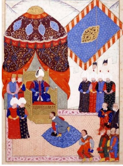
Resim 4: Sultan Süleyman'ın Erdel Kralını huzuruna kabulü, Nüzhetü'l-esrârî'l-ahbâr der Sefer-i Sigetvar, Feridun Ahmed Bey, 1568

Minyatür İncelemesi : Topkapı Sarayı Müze Kütüphanesi (H. 1339, y. 16b.) envanterinde yer alan minyatür Kanuni Sultan Süleyman'ın, Erdel Kralı Stefan'ı Belgrad yakınlarında Zemun'da kurulan Otağ-ı Hümayun'da kabulünü tasvir etmektedir (Arslatürk-Börekçi, 2012, 414).