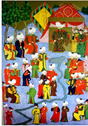
Resim 1: Sultan Osman Gazi'nin Cülüsü, Hünernâme I, Seyyid Lokman, 1579-1584.