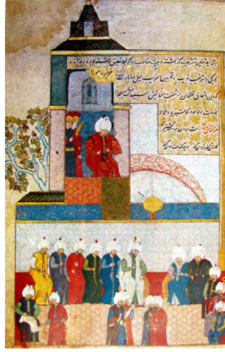
Resim 6: II. Selim'in Adalet Kulesi'nden Kubbealtı'ndaki Hedefi Vurması: Şehname-i Selim Han, Seyyid Lokman, 1581.

Topkapı Sarayı Müze Kütüphanesi (A. 3595, y. 11a.) envanterinde yer almaktadır. Minyatür II. Selim'in Adalet Kulesi'nden Kubbealtı'ndaki hedefi vurması ve Sokullu Mehmet Paşanın Divan-ı Humayun toplantısını tasvir etmektedir (Konak, 2007, 74).