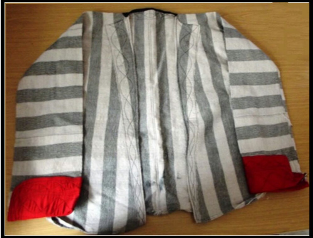
Resim 1: Gej dokuması rn, Bitlis yresi Őapik rneęi (Skmen-lmez, 2013, 175)