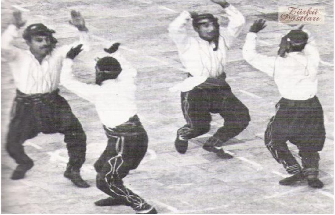
Resim 2: Bitlis'ten Muş'a Harkuřta, Bingöl'den Diyarbakır'a halay bölgesi oyunlarında benzer haliyle ve diđer adıyla "çepik".