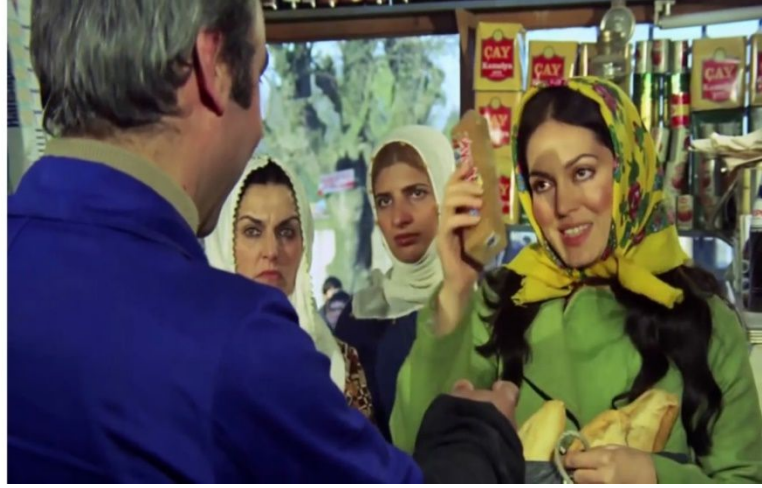
Resim.1 Sultan filmi afişi ve bakkal sahnesinden bir görüntü

Filme konu olan gündelik hayat meşakkatli ve yıpratıcıdır. Tüm zorlayıcılığına rağmen çocuklarıyla birlikte hayatta kalmaya çalışan Sultan, aynı zamanda toplumun dayattığı normlara uygun bir kadın olarak da yaşamak zorundadır. Kendi ayakları üzerinde duran bir kadın olmasına rağmen yine de “başımızda biri olsun” mantığından hareketle evlenmeyi düşünen Sultan, aslında ataerkilliğin toplumsal bellekte var olan kuvvetli yerine ilişkin ipuçlarını verir. Bu açıdan değerlendirildiğinde, evli olmanın toplumsal bellekte bir statü göstergesi olarak gösterildiği de söylenebilir. Ne ilginçtir ki filmin üzerinden kırk yılı aşkın bir süre geçmesine rağmen “evli olma hali” günümüzde de hala bir statü göstergesi olarak toplumsal bellekteki yerini korumaktadır.