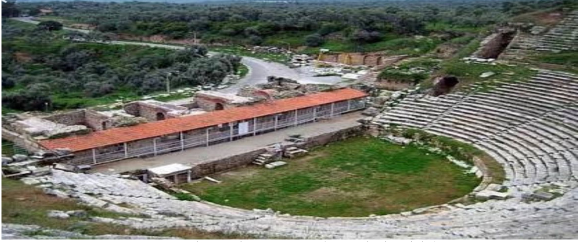
Resim 2.Nysa Antik Kentinden Bir Görünüm

Türkmenlerin bu bölgeye gelişi 1200 yıllarına dayanmaktadır. Yöre 1270 - 1307 yılları arasında Menteşoğulları Beyliği, ve 1307-1390 yıllarında Aydınolu Beyliği'ne katılmış, 1390 - 1922 yılları arasında Osmanlı Devleti'nin egemenliği altında kalmıştır. Sultanhisar, adını Aydınolu Beyliği'nin kurucusu Mehmet Bey'in kız kardeşi Nilüfer Sultan için yaptırdığı hisardan almaktadır. Bu ilçe Nilüfer Sultan'ın eseri olduğundan dolayı "Sultanhisar" olarak adlandırılmıştır. Milli Mücadele döneminde Kuva-yı Milliye'nin önemli direniş merkezlerinden birisi olmuştur. Yörük Ali Efe'nin, Sultanhisar Kavaklı Köyü'nden oluşu, milli mücadelede bu ilçenin önemini daha da vurgulamaktadır.