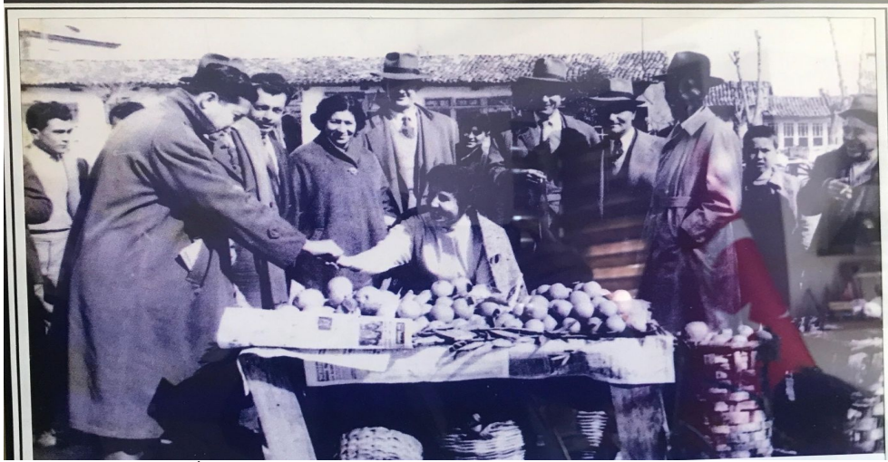
Resim 4. İlk Portakal Panayırı'ndan Bir Görüntü- 21.03.1940

Önceleri Portakal Bayramı ismi ile anılan şenlikler, daha sonraları şeftali, çilek şenlikleri olarak devam etmiştir (Adalığ, 2015, 24). Atça'da 1999 yılında başlayan festival ulusal düzeyde başlayıp, 2000 yılından itibaren uluslararası boyut kazanmıştır. 6360 sayılı Büyükşehir Kanunu sonrası belde belediyeleri kapatılarak bağlı oldukları ilçelerin mahallesi konumuna dönüştürülmüştür. Atça Belde Belediyesi de 6360 sayılı kanun Sultanhisar İlçesine bağlı Atça mahallesi statüsüne dönüşmüştür. 2014 yılından itibaren Sultanhisar ve Atça festivalleri birleştirilmiştir.