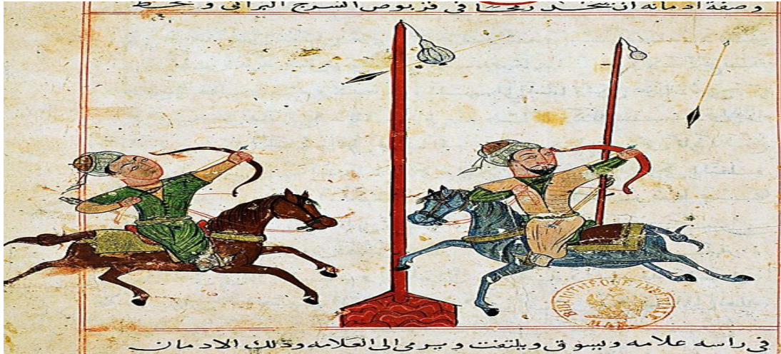
Resim 1: 14. Yüzyıl, Atıcılık talimi yapan okçuları tasvir eden bir minyatür (Ibn Ahî Hizâm, el-Maḥzûn câmi' u l-fünûn, Bibliothèque Nationale, MS, Kıpçaki Turkish, nr. 2824, vr. 28'a).

3.2 Jambu atu: Özel donatılmış yerleşim yerlerinden uzakta bulunan yeri ister. Ata binip koşan süvarin tüfek attığı nişan, seyircilerin karşı tarafında 3 metre yüksekliğinde koyulur ve 30 santim çapında yuvarlak topa benzer. Oyuna katılan her kesin, kendi atının ve tüfeğin olması lazım. Depara davet edilmeden önce o, bunun için sıkı belirtilmiş yerde beklemeli ve yarışmalarında davranış kurallarına kesinlikle uymalıdır. Yarışmacıların depara yani ateş hattına çıkışı, kura çekerek belli olur. Depar çizgisine davet edilen süvari, hakemden sadece bir fişek alır, tüfeğini durdurur ve verilen işaretten sonra bitişe doğru koşar. Nişandan birkaç metre önünde ateşi açar ve koşmaya devam eder. Her bir oyun yarışmacısına sadece bir atış yapmasına izin verilir ve böylelikle el sertliğini ve göz keskinliğini göstermek. Oyunu kazanan, nişanda fişekle yapılan en çok rahne sayısına göre belirlenir.