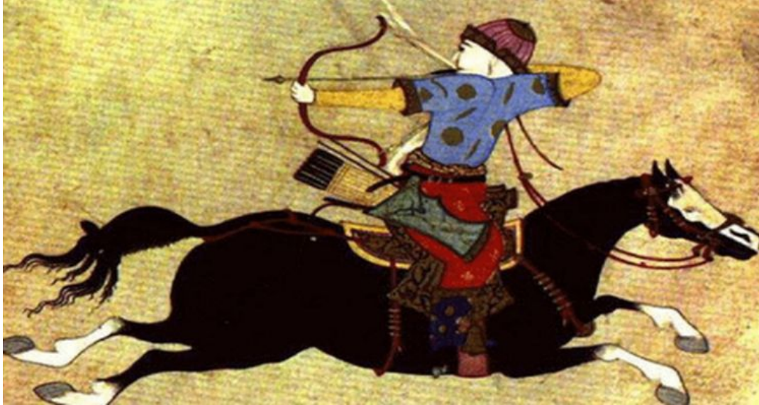
Resim 2: İlginç olan, kirişin bırakılma anını, atın dörtlüye gidiş hareketinin belirlemesiydi. Atın dört ayağının da yerden kesik olduğu kısacık anda -bu en sarsıntısız an olduğundan- kiriş bırakılıyordu. Bozkırların atlı okçusunun sanatının doruk noktası da buydu ve çok hassas bir ritim duygusuna sahip olmayı gerektiriyordu. Osmanlı'nın ilk dönemlerinde bu teknik, bir okçuluk hüneri olarak çeşitli vesilelerle sergileniyordu (BOA, 16. Yüzyıl).

Eski Türklerde özellikle güreş müsabaka veya yarışma şeklinde daha sonraki senelerde geleneksel bir hale dönüşmüş ve Türklerin ata sporları olarak tarihe kayıt edilmiştir (Şener ve İmamoğlu, 2018, 1091-1106). Spor alanında renklerin etkili olduğuna o devirlerde de inanılmış olmalıdır ki oyunlarda renkli sahnelere yer verilmiştir. Spor alanında özellikle takım sporlarındaki forma ve tişörtlerde, hatta tozluklarda renk seçimi