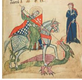
Şekil 3: St.George ve Dragon.

"Bir ejderi tepeleyip öldürmek, kahramanların (Herakles, Sigurd, St. Michael, St. George) beylik kahramanlıklarından biriydi. Germen mitinde, Ejderhalar değerli şeylere bekçilik ederlerdi. Yedinci ya da sekizinci yüzyılda, İngiltere'de yazılmış olan Beowulf'da da bir hazineye üç yüz yıl kadar gözcülük etmiş bir Ejderha vardır. Firar etmiş bir köle ejderin inine saklanır ve bir kupa çalar. Ejderha uyanınca hırsızlığı anlar ve hırsızını öldürmeye karar verir, fakat kupayı başka bir yere koymuş olmayayım diye düşünerek, emin olmak için, ikide bir geri döner. Ejderha, krallığın altını üstüne getirmeye başlar; Beowulf onu arayıp bulur, boğuşur ve öldürür; ve ejderhanın dişlerinin açtığı öldürücü bir yara yüzünden çok geçmeden kendisi de ölür" (Borges, 1974, 43).