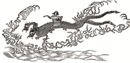
Şekil 1: Okyanus üzerinde uçan Asya ejderi-dragon- Kutsal Yü Kiang

“ Belki de en çok bilinen örnek ejderhadır. Bu efsanevi canavara dair Mezopotamya kaynaklı hikayeler zamanla antik Yunan dünyasına, Çin’e ve Japonya’ya yayılmıştır. Ejderha Asya’da uğurlu bir yaratığa, bir talih taşıyıcısına ve bir kraliyet simgesine dönüşür. Yunanistan’da ise kahramanların alt etmesi gereken bir varlık olarak daha canavarımsı niteliğe bürünür”(Dell, 2014,244).