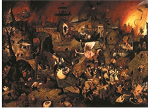
Şekil 7: Pieter Bruegel the Elder, “Deli Meg” , Panel Üz. Yağlı boya, 1562, 115x161 cm ,MuseumMayervan der Bergh, Anvers, Belgium.

“İlkel toplumlar için doğa, gizemli, korkutucu ve kutsaldır. Özellikle Doğu’da, Doğu toplumları arasında yaygın olan masal, destan ve mitolojik söylenceler, kültürel değerler, insanın hayal gücünü yansıtlar. İnanç ve hayal kurma sınırsızdır. Doğa yasaları diye bir kavram henüz oluşmadığından ve de doğayı insan aklını temel alan katı kurallar içinde görme alışkanlığı da olmadığından, ilkel toplumlar dünyayı üst tarafı gökyüzü, sarısı yeryüzü, çevresindeki sıvıyı da denizler olarak bir yumurta şeklinde tasvir edebilirlerdi. İlkel insanın hayal gücü doğa olaylarına açıklama getirmek için mitolojik kurgular üretir. Bu kurgular, aslında insan zihninin yarattığı hayali varlıklar olmalarının yanında bunları yaratan zihin için birer gerçektirler” (Aytekin, 2007, 258-259).