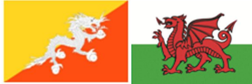
Şekil 4 ve Şekil 5: Buhutan ve Galler Bayrakları ve ejderha s-imgeleri

Batı felsefesinde Örneğin; Homeros'un İlyada'sının onbirinci bölümünde, Agamemnon'un kalkanı üzerinde bu sefer yedi veya iki değil de, üç başlı, mavi (kutsal gökle bağlantılı) bir ejderha buluruz. Bu ejderha daha sonra İskandinav korsanlarının kalkanlarının üzerindeki resimlerde de görülmektedir. Uzun gemilerde de görülen ejderha başları, Romalılarda piyade taburunun nişanı, İngiltere'de Sakson krallarının bayraklarında bulunan, önemli ve korkulan bir güç figürü idi. Günümüzde de eskiden olduğu gibi, belli bir topluluğun-milletin simgesi, işareti, ileti nesnesi olarak, Doğu-Asya, Batı bayrak sembolü ejderha s-imesi (Şekil 1 ve 2: Buhutan ve Galler bayrakları) farklı şekillerde bayraklarda görülebilmektedir.