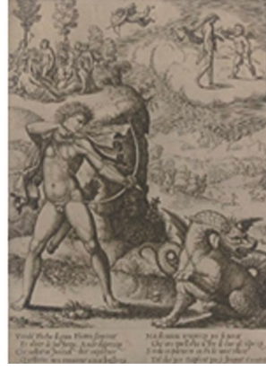
Şekil 2: Apollonun Python'u öldürmesi,1532, metal gravür resim

Çin'de ejderha kelimesi karşılığı olan long kelimesinin anlamı, tek bir simge ya da canlı karşılığında kullanılmamaktadır. Çin'in en karmaşık s-imgelerinden biri olarak da verilen long/lung kelimesinin karşılığı olan birden çok ejderha türü, dört farklı özellik ve yön anlamına da gelmektedir. Dört sayısının anlamı önemlidir. Doğu'da dört sayısı Batı'yı ve bölünmüş olan kare- yeryüzünü- simgelemektedir. Eski Krallıklarda dört yön, dört deniz, dört dağ ve dört barbar halktan bahsedilmektedir. Dört sayısı si sözcüğü, ölüm sözcüğü ile eşeslidir. Aynı zamanda da feodal düzendeki dört nesne-eski kültür, -eski adetler,-eski alışkanlıklar,-eski düşünce tarzı ile savaşılmaktadır (Eberhard, 2000).