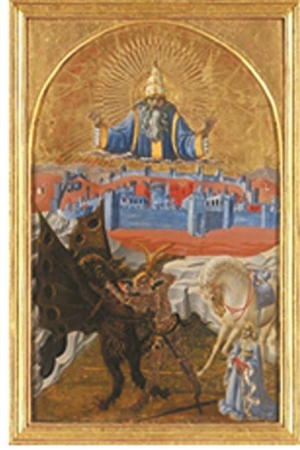
Şekil 6: Paulo Uccello . , “St. George Slaying the Dragon” (St George’un Ejderhayı Öldürmesi) yaklaşık 1470 .

Batı’da ve Doğu’da da, temelde, tüm insanların ruhindaki ortak öğelerin, kolektif bilinçdışının düşe, mite kattığı ortak anlam ve biçimlerinin, düş görenin (öncelikle kişide gerçekleşen) ortak kültür ve sanat , inanç sistemlerindeki arketipsel ilk örnekleri, insanın ve toplumların gereksinimlerine göre farklılaşarak başka zamanlarda da yeniden ortaya çıkan ruhtaki zıtların ortaklıkları, bileşimleri olarak kabul edilmektedir.