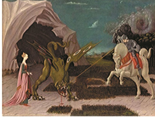
Şekil 11: Paolo Uccello(1397-1475), "Saint George and the Dragon"(St. George ve Ejderha) , 1456-60, Ahşap üzerine Tempera.

Paolo Uccello, Floransa doğumlu İtalyan ressam, Floransa Okulu üslubunun gelişiminde etkili ve İtalyan Rönesans Sanatının öncü ustalarındandır. Resim sanatına çizgisel perspektifi sokan Uccello'nun "Saint George ve Dragon" adlı eseri, Orta Çağdaki azizlerden biri olan St. George ve Altın Efsane çıkışlıdır. St. George, Türkiye- Kapadokya'da bir Hıristiyan şövalyesidir. George efsaneye göre, bir gün Libya'da bir ejderha tarafından terörize edilen Silene şehrine gelir. Tüm koyunları yemiş olan bu canavar, hem zengin hem de yoksul olan çocuklar tarafından beslenir. Gelin olarak giyinmiş ve ejderhanın yaşadığı yere teslim olan kralın kızının, atının yanından geçen George, neden ağladığını sorar. Ejderha George saldırdığında ortaya çıkar ama onu öldürmek yerine prensesine kemerini boynuna bağlamasını ve şehre götürmesini söyler. Orada, korkmuş vatandaşlara, hepsi Hıristiyanlığa dönüştürülürse onu öldüreğine söz verir. Aceleyle kabul edilir ve George ejderhanın kafasını vurur. Paolo Uccello, hikayenin iki bölümünü küçük ve belirgin şekilde bir tabloya yerleştirir. Şahlanan at üzerindeki aziz mızrağını, şekli mağarasının girişini yansıtan tuhaf bir şekilde üçgen bir ejderhanın kafasına sokar; zarif, ama oldukça sıkılmış görümlü prensesin yanındaki ejderhanın boynunda bir tasma vardır.