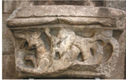
Şekil 8: Altay ve Sibiry Türk topluluklarında, gökgürültüsü tasviri, hayvan biçimli ejderha, düzenli dünya karşısında kaosun bir sembolü

Doğa kelimesi sözlük anlamında; “ İnsan eli ile büyük değişikliğe uğramamış, doğal yapısını koruyan çevre, tabiat ve bir kimsenin eğilimlerinin, içgüdülerinin hepsi, huy” (TDK, 2011, 688) olarak geçmektedir. Tabiat –biçimden yoksun, uyumsuz yani kaos- evrenin düzene girmeden önceki hali- ve uyumlu, düzenli bir bütün olarak tüm varlıklar-kozmos-evren tasarımları, hlk. “Büyük yılan” (TDK, 2011, 838) birliğinin sembolü; toprakla özdeşleştirilen ve tanrısal yaratma niteliğinin, kadınsı doğurma özelliği ile birleşimi; Toprak Ana (tarihte eski dönemlerin büyüsel-dinsel gücün, toplumsal üstün modeli-evrenin birliğinin ve evren üzerinde egemen, ölüm ve yaşamı tek başına s-imegeleyen )Anaerki zamanların, Ana Tanrıça kültürünün cisimleşmesidir.