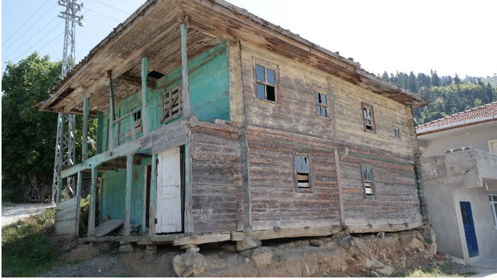
Resim 2: Kuzören Köyü Camii'nin kuzeybatı cepheden görünümü.

Kible duvarı ortasında kısmen harap olmuş mihrap nişi, dikine çakılmış tahtalardan oluşturulmuşken kenarları eğik çakılmış enli tahtalardan oluşturulmuştur. Mihrabın güneybatısında yer alan minberin korkulukları, ince çıtaların geometrik şekiller oluşturacak şekilde çakılmasıyla meydana getirilmiştir.