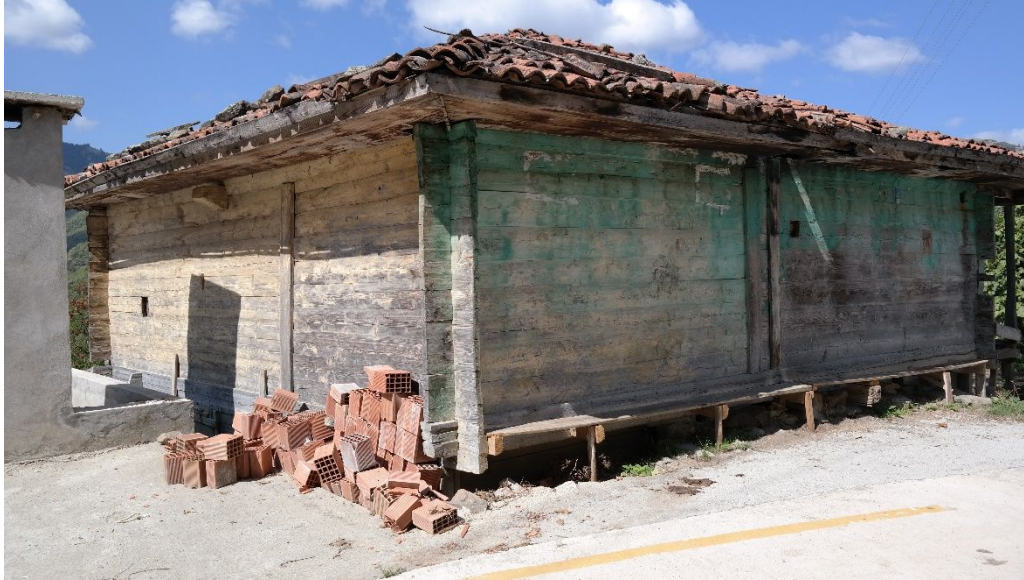
Resim 3: Kuzören Köyü Camii'nin güneydoğu cepheden görünümü.

Harimi U şeklinde dolanan kadınlar mahfiline caminin kuzeyinde revak benzeri bölümün üst katı ortasındaki kapı ile girilmektedir. Yapı inşa edilirken zeminin düzleştirilmesi amacıyla doğu cephenin bulunduğu alan kazılarak aşağıya çekildiğinden caminin üst katı doğu cephede aşağı yukarı yer seviyesine hizalanmıştır. Dolayısıyla camiye kuzey yönde ekli son cemaat mahalli benzeri bölüm aynı şekilde üst katta da yer aldığından sözü edilen yere kuzeydoğu köşeden rahatlıkla girilebilmektedir. Üst kattaki mahfilin batı kolu güneye doğru minberle bitştirilmiş gözükmetedir. Harime mihrap hizasında yarı daire şeklinde kavisli minber köşkünün korkulukları, tıpkı mahfil korkulukları gibi, ince çitalardan oluşturulmuş olup