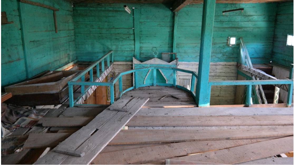
Resim 5: Kuzören Köyü Camii'nin mahfilden görünümü.

Bir minaresi bulunmayan yapıda süslemeye de hemen hiç yer verilmemiştir. Köy halkıyla yaptığımız görüşmelerde caminin yıkılarak bulunduğu alanın çeşitli amaçlar için kullanılmasının arzu edildiği anlaşılmıştır.