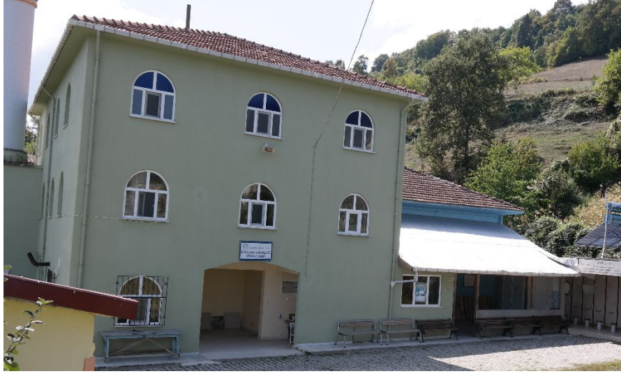
Resim 6: Karaaba Köyü Ahşap Camii ile hemen yanındaki betonarme cami.

Karaaba Köyü Ahşap Camii'nin ilk kez ne zaman yapıldığı tam olarak bilinmemektedir. Mihrabın üst kısmındaki ahşap levha üzerine oyulmuş 1972 tarihi, caminin onarımıyla ilgili olmalıdır. Yöredeki diğer camilerle kıyaslandığında incelemiş olduğumuz ahşap cami, 20.yy'ın ilk yarısına tarihlendirilebilir.