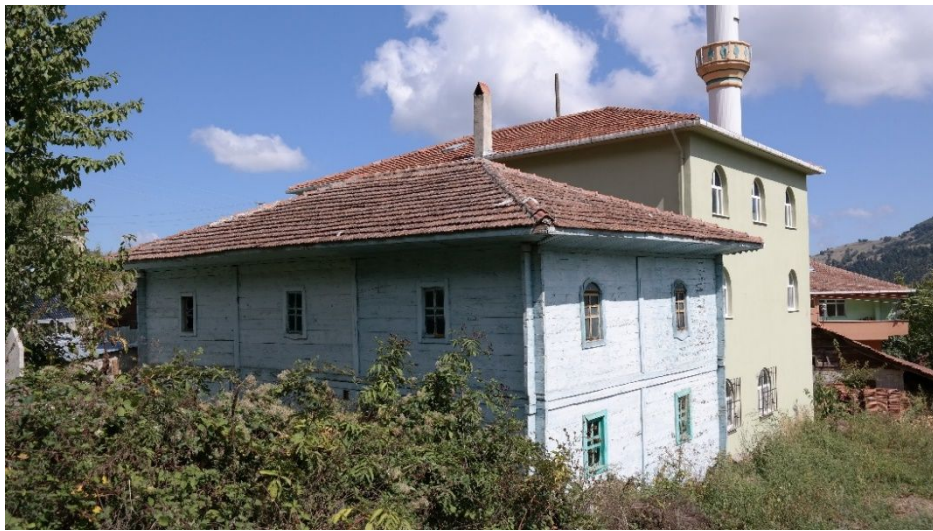
Resim 7: Karaaba Ky Ahşap Camii'nin gneydoęu cephelerinden grnm.