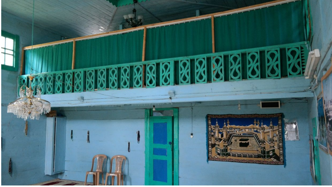
Resim 10: Karaaba Köyü Ahşap Camii'nin mahfili.

Kible duvarı ortasında yer alan mihrap nişi, dikine çakılmış tahtalardan oluşturulmuştur. Kenarlardaki yeşil mavi yarı daire dizileri mihraptaki süslemeleri oluşturmaktadır. Yaklaşık 50 cm genişliğindeki mihrap sekisi üzerindeki süslemeler ise, ince çıtalarla çevrelenmiş boyuna dikdörtgen açıklıkların içindeki S dizileri şeklindedir. Caminin batı cephesine yaşlı minber, klasik elemanlara sahip sade bir nitelik sunmaktadır. Minber köşkünde görülen ters-düz hilal motifleri minberdeki süslemeler olarak değerlendirilebilir.