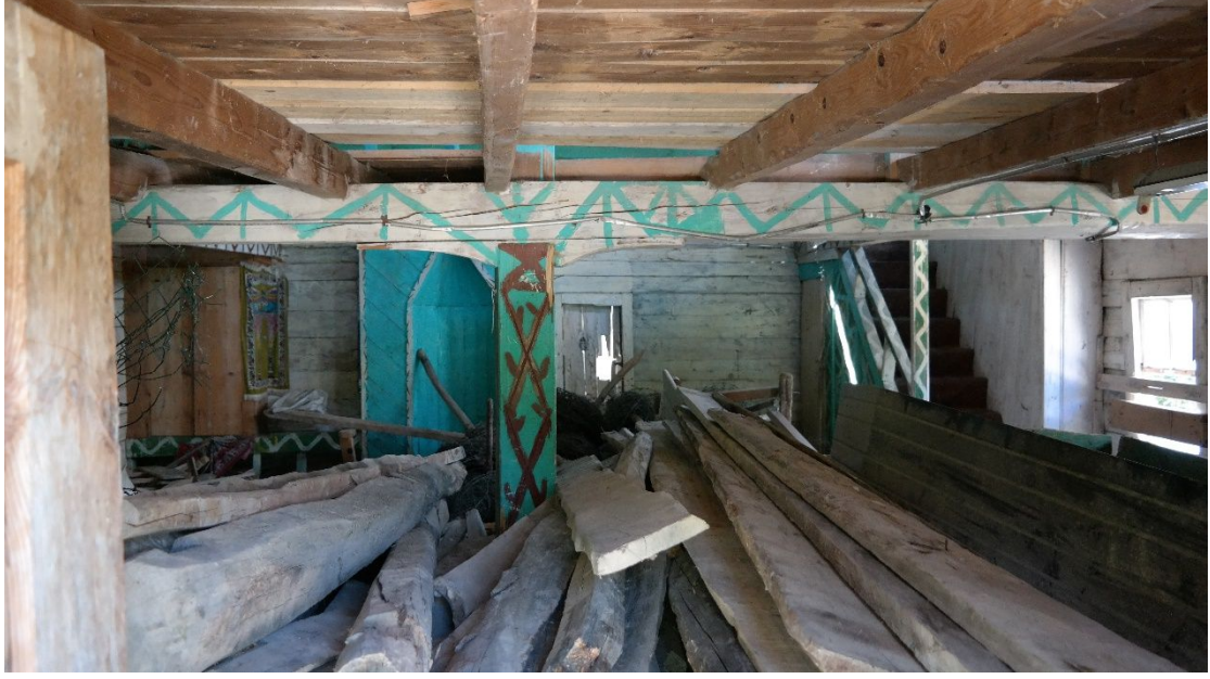
Resim 4: Kuzören Köyü Camii'nin harimden görünümü.

basit karakterlidir. Camide en ilginç husus ise mihrap ve mahfil köşkünün yapının tam ortasında şakûlî hizada olmayıp doğuya yakın konumlandırılmasıdır. Yapının ilk inşa edildiğinde bu şekilde planlanıp planlanmadığı tam olarak anlaşılamamaktadır. Belki de inşaattan bir müddet sonra cami batı yönde genişletildiğinden mihrap ve mahfil köşkünün yapı içindeki simetrisi bozulmuş olabilir.