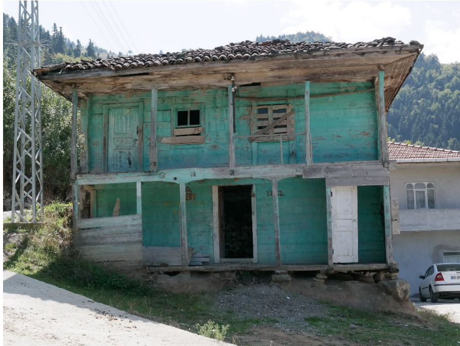
Resim 1: Kuzören Köyü Camii'nin kuzey cepheden görünümü.

Kuzören Köyü'ne, Yakakent ilçe merkezinden güney istikametine, yer yer bozuk, yaklaşık 20 km asfalt bir yol ile ulaşılmaktadır. Köyün içinde hafif meyilli bir alanda kurulu bulunan ahşap cami, günümüzde köy içine yapılan betonarme yeni bir cami nedeniyle kullanılmamakta olup kısmen harap vaziyettedir.