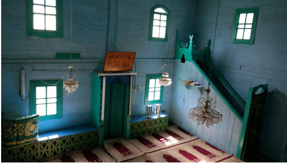
Resim 9: Karaaba Köyü Ahşap Camii'nin mahfilden harimin içi.

Harimin içi alt katta doğu ve güney cephede ikişer; üst katta güney cephede iki, doğu ve batı cephelerde üçer olmak üzere toplam 12 pencere ile aydınlatılmaktadır. Boyuna dikdörtgen açıklıklı pencereler içten ve dıştan ince tahtalarla çerçeve içine alınmıştır. Ayrıca üst kattaki güney ve doğu cephelerdeki beş pencere üstten eğik tahtalarla çevrelenmiş olup basık kemer görüntüsü sunmaktadır.