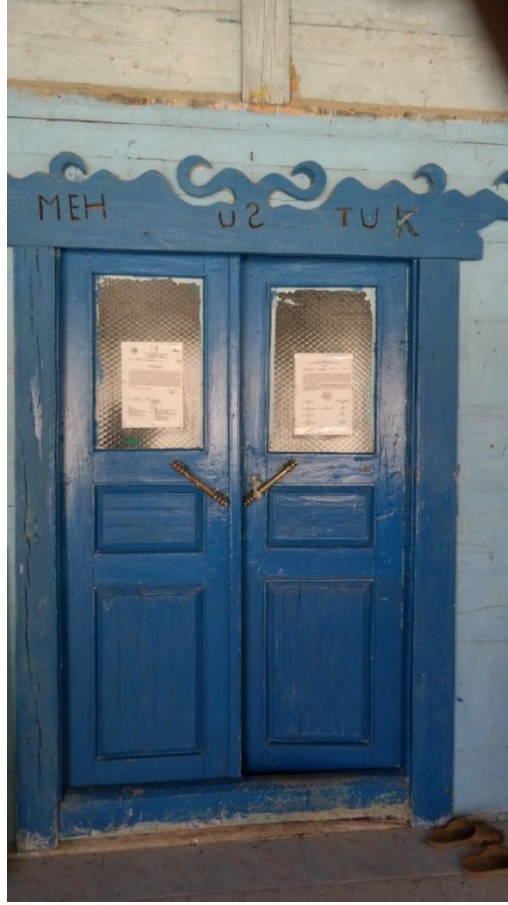
Resim 8: Karaaba Köyü Ahşap Camii'nin giriş kapısı üzerindeki usta adlarının kısaltılmış hali.

Harimin içi alt katta doğu ve güney cephede ikişer; üst katta güney cephede iki, doğu ve batı cephelerde üçer olmak üzere toplam 12 pencere ile aydınlatılmaktadır. Boyuna dikdörtgen açıklıklı pencereler içten ve dıştan ince tahtalarla çerçeve içine alınmıştır. Ayrıca üst kattaki güney ve doğu cephelerdeki beş pencere üstten eğik tahtalarla çevrelenmiş olup basık kemer görüntüsü sunmaktadır.