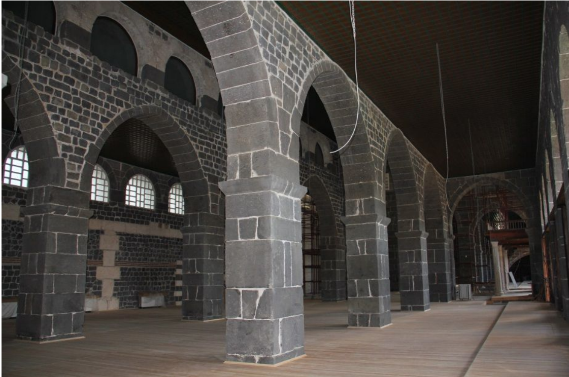
Foto:12- Ulu Camii'nin İç Mekanı İki Katlı Kemer Uygulaması