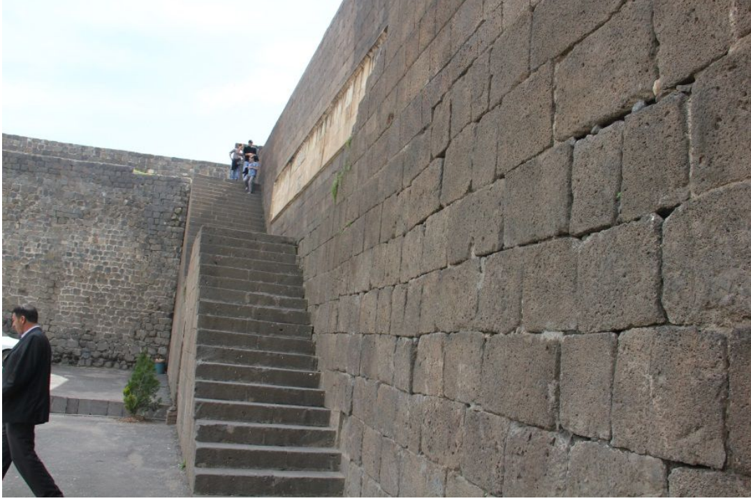
Foto:9- Amid Kalesi'ne ıkışı Saęlayan Merdivenler