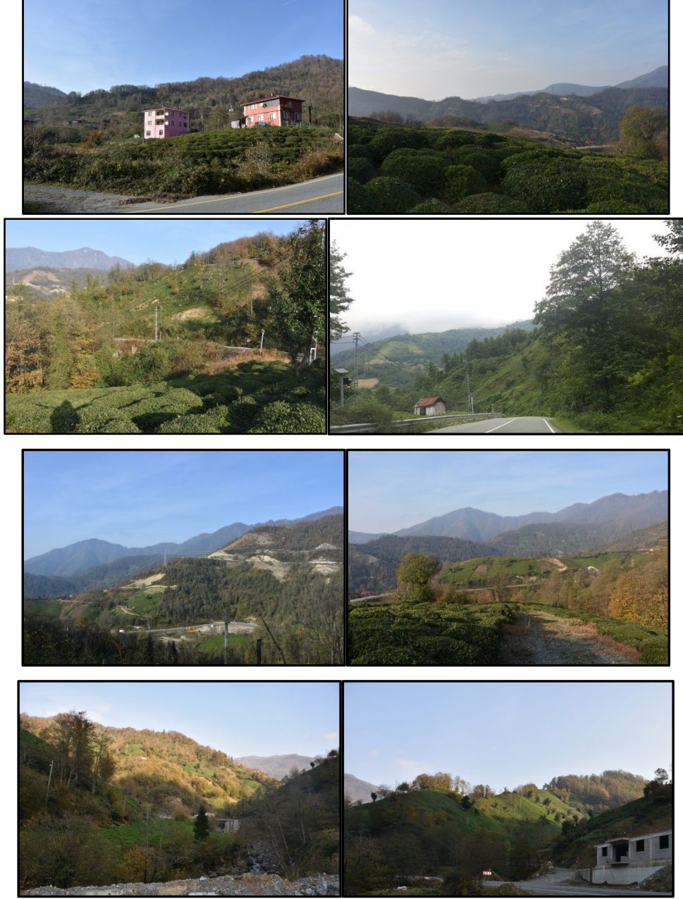
Şekil 2. Çalışma alanında çay- topoğrafya ve çay-ağaç birlikteliğinin görülebildiği bazı peyzajlar

Ülkemizin sahip olduğu coğrafi konumu ve bulunduğu iklim kuşağı, bölgeleri karakterize eden farklı tarımsal peyzaj tiplerini ortaya çıkarmaktadır. Ege bölgesinin tarımsal peyzaj tipini zeytin, Doğu Karadeniz Bölgesini ise çay ve fındık karakterize etmektedir. Dünya’da sudan sonra en fazla içilen içecek olan çay, Doğu Karadeniz bölgesinin önemli geçim kaynaklarından birini oluşturmaktadır.