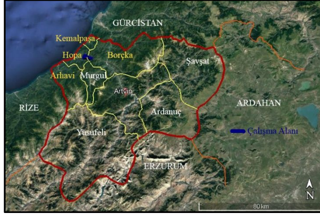
Şekil 1. Çalışma Alanı

Türkiye Turizm Stratejisi 2023’de belli bir güzergâhın doğal ve kültürel dokusunun yenilenerek belli temalara dayalı olarak turizm amacıyla geliştirilmesi hedeflenmektedir. Buradan hareketle, Cankurtaran tünelinin açılması sonucu daha az kullanılan (sadece o güzergâhta yaşayanlar ve macera severler) bir güzergâh olan alan seçilmiş ve bu alanda yaşayanların kültürel farklılıkları ve alanın sahip olduğu çay alanlarının görsel değerleri de dikkate alınarak çay turizmi potansiyelinin ortaya konulması amaçlanmıştır.