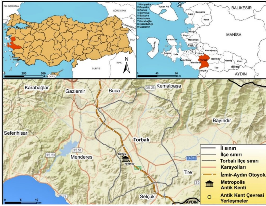
Şekil 1: Metropolis Antik Kenti Lokasyon Haritası

Metropolis, her ne kadar döneminin önemli bir kenti olsa da kentte yapılan arkeolojik bilimsel çalışmalar çok eskilere dayanmamaktadır. Bu durumun temelinde ise Ephesos'a yakınlığı dolayısıyla tüm ilginin bu kentte yoğunlaşması nedeniyle seyyahların ve ilk araştırmacıların Metropolis'i gözden kaçırmaları ya da ihmal etmesi yatar. Kentten ilk söz eden araştırmacılar XVII. ve XVIII. yüzyılda bölgeyi anlatan çalışmaları ile Spon ve Wheler'dir. Sahadaki ilk bilimsel çalışma 1860'lı yıllarda İzmirli araştırmacı A. Fontrier tarafından yapılmıştır. Sonraları Ephesos Antik Kenti'nde kazılar yapan Avusturyalıların uzaktan ilgilendikleri ve ziyaret ettikleri bir yer olsa da Metropolis Antik Kenti'nde 1971 yılına kadar derinlemesine çalışmalar yapılmamıştır. Recep Meriç başkanlığında 1989-1991 yılları arasında kente yapılan kazılar, Metropolis Antik Kenti'nde yapılan ilk bilimsel kazı olma özelliğindedir. Günümüzde de devam eden kazılar sonucunda görkemli bir Tiyatro, Stoa, Bouleuterion ve Roma Hamamı'nın ortaya çıktığı Metropolis'te; Hellenistik yapılar, yazıtlar ve heykellerin keşfedilmesiyle Hellenistik Uygarlık'ın varlığı saptanmıştır (Aybek, 2004).