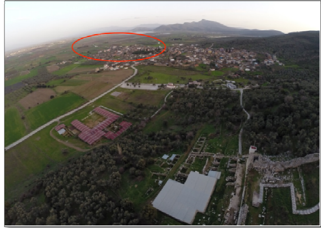
Şekil 2b: Metropolis ve Yeniköy Mahallesi