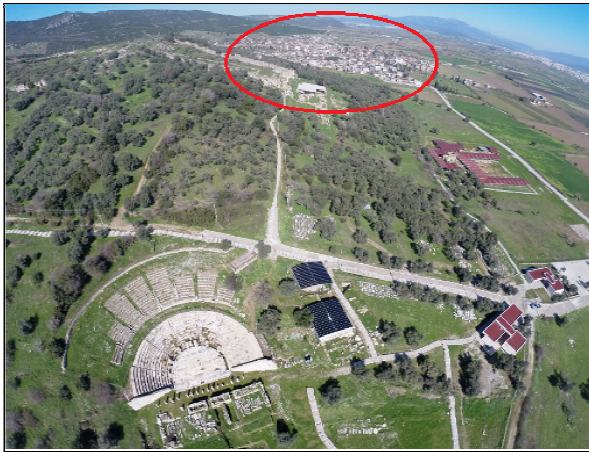
Şekil 2a: Metropolis ve Özbek Mahallesi

Metropolis, her ne kadar döneminin önemli bir kenti olsa da kentte yapılan arkeolojik bilimsel çalışmalar çok eskilere dayanmamaktadır. Bu durumun temelinde ise Ephesos'a yakınlığı dolayısıyla tüm ilginin bu kentte yoğunlaşması nedeniyle seyyahların ve ilk araştırmacıların Metropolis'i gözden kaçırmaları ya da ihmal etmesi yatar. Kentten ilk söz eden araştırmacılar XVII. ve XVIII. yüzyılda bölgeyi anlatan çalışmaları ile Spon ve Wheler'dir. Sahadaki ilk bilimsel çalışma 1860'lı yıllarda İzmirli araştırmacı A. Fontrier tarafından yapılmıştır. Sonraları Ephesos Antik Kenti'nde kazılar yapan Avusturyalıların uzaktan ilgilendikleri ve ziyaret ettikleri bir yer olsa da Metropolis Antik Kenti'nde 1971 yılına kadar derinlemesine çalışmalar yapılmamıştır. Recep Meriç başkanlığında 1989-1991 yılları arasında kente yapılan kazılar, Metropolis Antik Kenti'nde yapılan ilk bilimsel kazı olma özelliğindedir. Günümüzde de devam eden kazılar sonucunda görkemli bir Tiyatro, Stoa, Bouleuterion ve Roma Hamamı'nın ortaya çıktığı Metropolis'te; Hellenistik yapılar, yazıtlar ve heykellerin keşfedilmesiyle Hellenistik Uygarlık'ın varlığı saptanmıştır (Aybek, 2004).