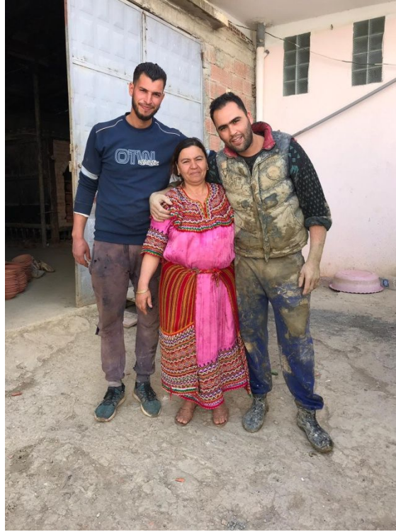
Şekil 7. Sırlama işlemi yapan kadın çömlekçi ve yerel kıyafetli görüntüsü