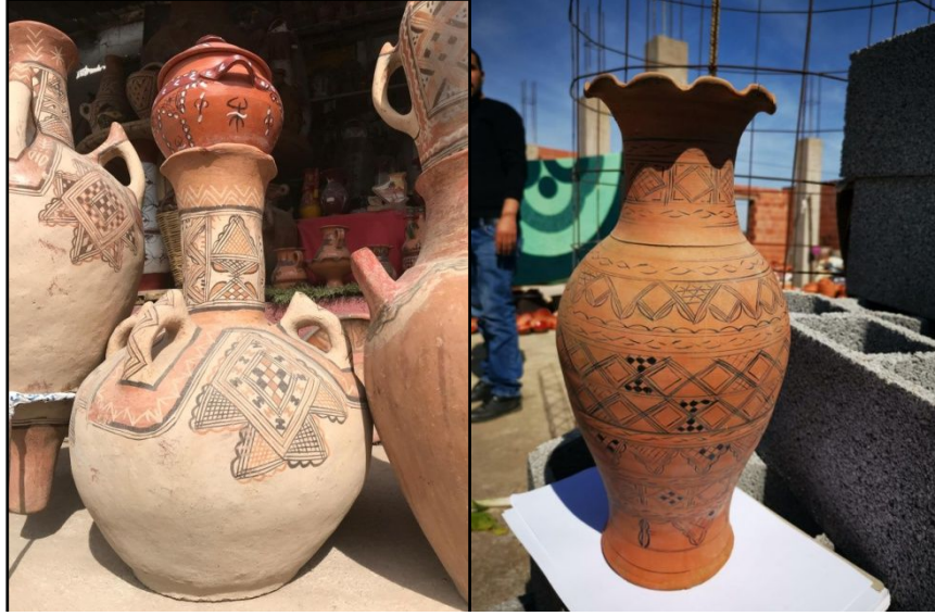
Şekil 9. Çömlekler üzerindeki yerel desenler

Bu süsleme ve formlar; erkeklerin çömlek yaptığı kent merkezlerinden çok farklıdır. Erkekler çömlekleri çarkta şekillendirip, parlak dekor uygulayıp, büyük fırınlarda sırla işlem yaparken; kadınlar, elle şekillendirme yapmakta ve çömlekleri doğal yapılmış boyalarla, el ve parmaklarını kullanarak boyamaktadır (Şekil 10).