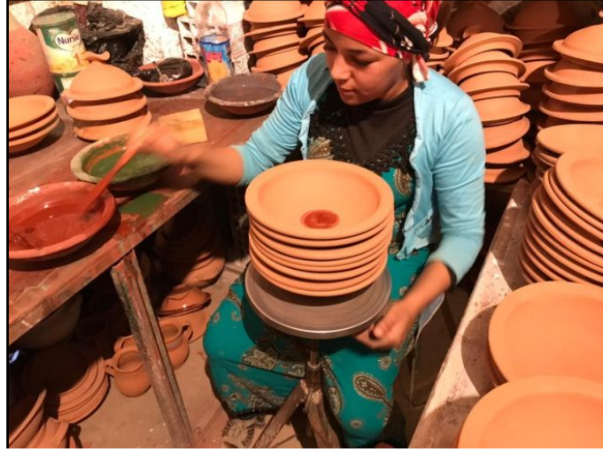
Şekil 6. Bezeme işlemi yapan kadın çömlekçi