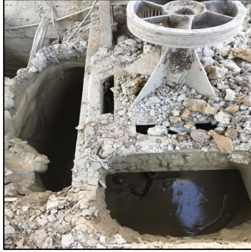
Şekil 2. Çamur Hazırlama

atölye dışında gerçekleştirilmektedir. İlk aşamada; killer bir çukur içerisine yerleştirdikleri karıştırıcılar yardımıyla su eklenerek karıştırılmaktadır (Şekil 2).