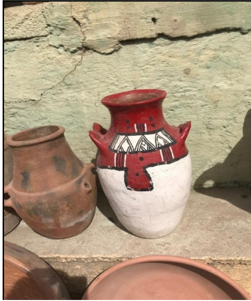
Şekil 10. Parmakla boyanmış bir çömlek örneği.

Bu süsleme ve formlar; erkeklerin çömlek yaptığı kent merkezlerinden çok farklıdır. Erkekler çömlekleri çarkta şekillendirip, parlak dekor uygulayıp, büyük fırınlarda sırla işlem yaparken; kadınlar, elle şekillendirme yapmakta ve çömlekleri doğal yapılmış boyalarla, el ve parmaklarını kullanarak boyamaktadır (Şekil 10).