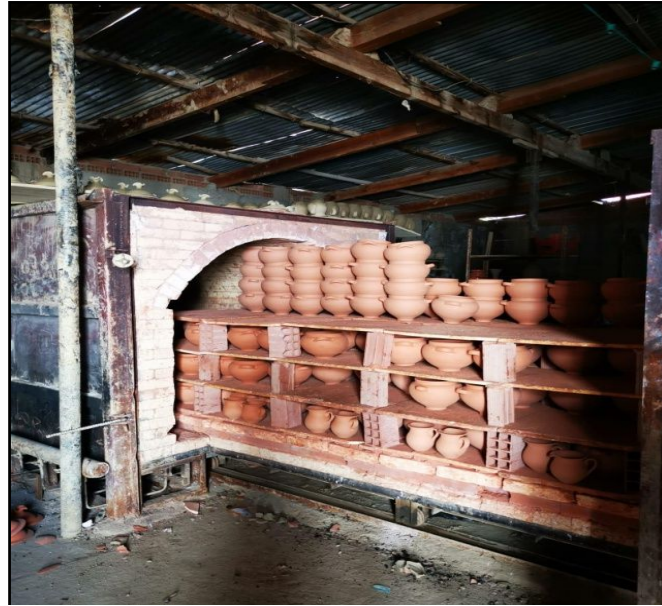
Şekil 5. Pişirim işlemi

Pişirim işlemi elektrikli ve raylı fırınlarda gerçekleştirilmektedir. Çarkta üretilen çömlekler ilk pişirimleri 600°C sırlı pişirimleri olan ikinci pişirimleri 900°C'de gerçekleştirilmektedir (Şekil 5). Kadınların ürettiği geleneksel çömlekler açık havada pişirilmektedir. (Kişisel iletişim, 6 Mart 2019).