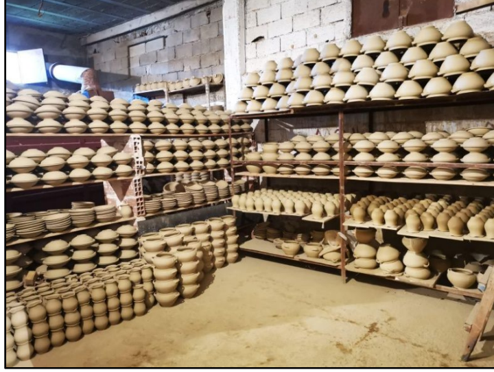
Şekil 4. Raflarda kurutma işlemi

kurutma işlemi yapılarak nemi alınmaktadır. Bu yüzden; kurutma işlemi genel olarak iç mekânlarda raf sistemi ile yapılmaktadır (Şekil 4). Ürünler ahşaptan yapılmış uzun plaka şeklindeki altlıklarda taşınmakta ve bekletilmektedir. Kurutma işlemi iklim koşullarına bağlı olarak 3 ila 5 gün sürmektedir (Kişisel iletişim, 6 Mart 2019).