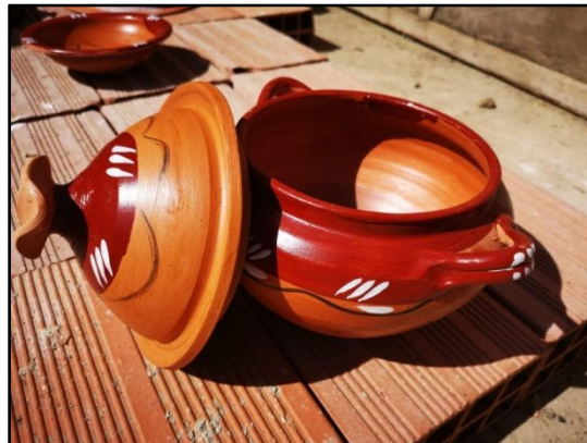
Şekil 8. Canlı renk uygulamaları