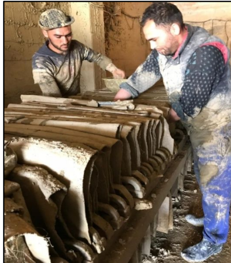
Şekil 3. Çamurun vakum preste hazırlanması.

Draâ El Mizan Bölgesinde şekillendirme işlemi, çarkta şekillendirme ve elle şekillendirme olarak iki farklı yöntemle yapılmaktadır. Çarkta şekillendirme işleminde elektrikli tornalar kullanılmaktadır. Bu işlem erkekler tarafından yapılmaktadır. Elle şekillendirme işlemi ise, yaşlı bayanlar tarafından yapılmaktadır. Bu yöntem az da olsa gençlere öğretilmekte olup gelecek kuşaklara kalması hedeflenmektedir. Ancak Üretim şekli hakkında çok az şey bilinen bu yöntem yerel halk tarafından gizli tutulmaktadır (Kişisel iletişim, 6 Mart 2019).