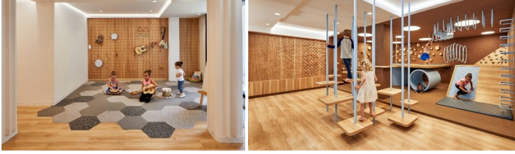
Resim 4.3. Nía School, Meksika (URL 5)

Meksika’ da bulunan örnek okulda da çocukların ahşapla temasta bulunmasını sağlayacak birçok alanda ahşap kullanıldığı görülmektedir. Zemin döşemesi olarak ahşap kaplama tercih edilmesinin yanında duvarda çocukların hayal gücüne bağlı olarak çeşitli kullanıma uygun delikli ahşap panel kullanılmıştır. Bu kısımda zeminde kauçuk kullanılarak doku farklılığı ile yeni bir alan tanımlanmıştır. Ayrıca bu alanda çocukların farklı dokuları tanımlayarak doku duygusunun gelişimine de katkı sağlanmıştır. Tavandan sarkıtılan metallere ve ahşaplarla mekan içinde çeşitli oyun alanları elde edilmiştir. Mekanın duvarında ve tavanda açık renk kullanılarak ahşabın ön plana çıkması sağlanmıştır. Ayrıca led aydınlatmanın olduğu asma tavanın ortama farklı bir hava kattığı görülmektedir (Resim 4.3).