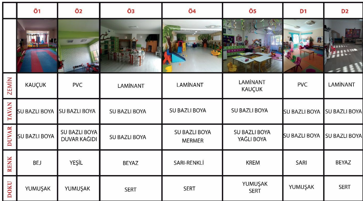
Çizelge 6.1. Anaokullarının malzeme analizi

İncelenen yurtdışı anaokulu binalarında ise doğal ve/veya yerel malzeme kullanımı yoğundur. Bu yoğunluk olumlu bir durumdur çünkü çocuklara zarar vermeyen ya da olabildiğince az zarar veren maddelerin kullanımı onlar açısından pozitif bir olgudur. Binalarda kullanılan ahşap, doğal taş, saman, bambu gibi malzemelerin sıklığı oldukça fazladır. Malzeme seçiminde yapının yapıldığı yörede malzemenin kolay bulunabilir olması bu gibi durumlarda etkili olmaktadır. Bu malzemelerin sağlığa zararsız olması, işlenebilir olması, görsel açıdan beğenilmesi ve çeşitli renk ve dokulara sahip olmasının yanında doğal ve ekonomik malzeme olmalarının da malzeme olarak kullanılmasında etkisi büyüktür (Elibol ve ark., 2006, 42). Ayrıca, kullanılan doğal malzemelerin çeşidi arttıkça çocuğun çevreye olan farkındalığı da aynı derecede artış gösterir. Çocuğun iç ve dış mekan bağlamında farklı malzeme ve dokularla iletişim içinde olması, onların duyuusal becerilerinin artmasında oldukça önemlidir. Çocuğun doğayla kurduğu ilişki onun farklı canlı veya cansız nesne ve malzemelerle karşılaşmasına, görsel, işitsel ve dokunsal algısının gelişmesine olanak tanır (Öztürk ve Bayrak, 2017, 34).