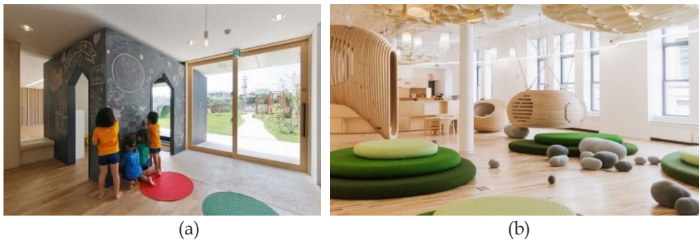
Resim 4.2. (a) Hanazono Anaokulu, Tokyo, Japonya (URL 3), (b) We Grow okulu, ABD (URL 4)

Japonya’ da bulunan örnekte de duvar ve zemin döşemesinde ahşap tercih edilmiştir. Ayrıca çocukların duvarları yazma-çizme eğilimleri de düşünülerek yazabilecekleri bir duvar yüzeyi oluşturulduğu görülmektedir. Böylelikle çocukları kısıtlamayan, onları oyuna ve öğrenmeye teşvik eden bir ortam oluşturulmak istenmiştir (Resim 4.2a).