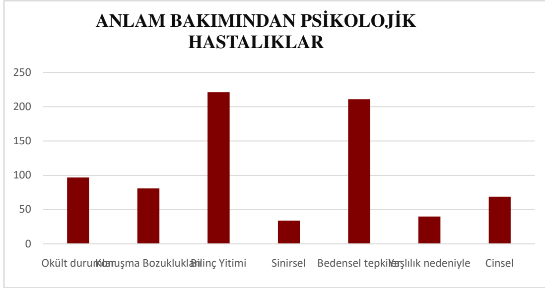
Grafik 2: Anlam Bakımından Psikolojik Hastalıklar

3. Bu hastalıklardan bilinç yitimi şeklindeki hastalıklar, akıl hastalıkları, sinirsel psikolojik hastalıklar ve yaşlılığın beraberinde getirdiği hastalıklar uzun süreli örtmece hastalıklar grubundadır. Konuşma bozuklukları, tedavisi mümkün olan örtmece hastalıklara, okült durumlar korku, hurafe ve inançlara dayalı örtmece hastalıklara, son olarak cinsel hastalıklar ise ayıp, kaba ve müstehcen kabul edilen örtmece hastalıklara örnektir.