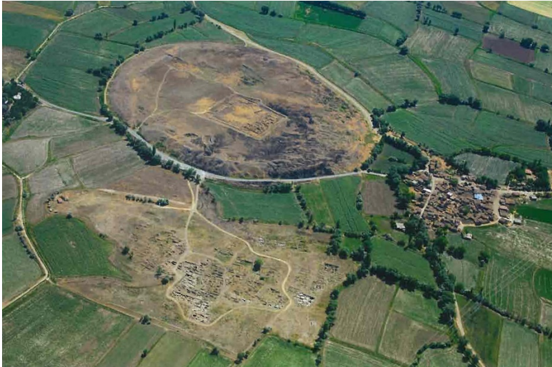
Figür-2. Kültepe Genel Görünüm (Kulakođlu, 2011).