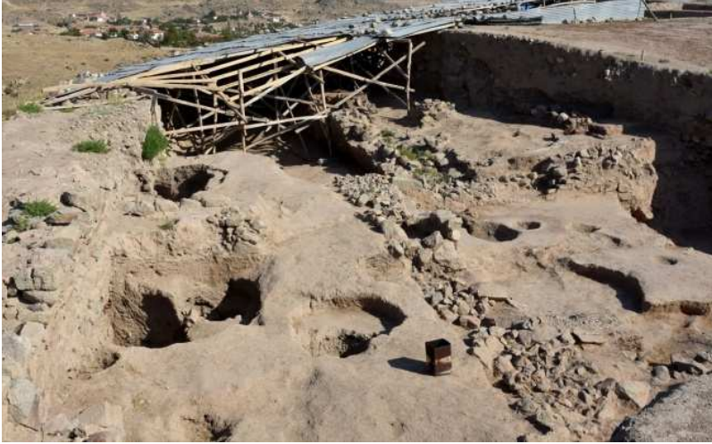
Figür-7. Büklükale Kazı Alanı ( https://www.kulturportali.gov.tr/turkiye/kirikkale/kulturenvanteri/buklukale )