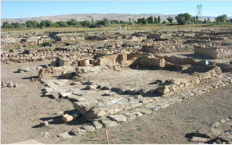
Figür-4. Kültepe Kazı Alanı ( https://www.kulturportali.gov.tr/turkiye/kayseri/gezilecekyer/kultepe-kanis-karum )