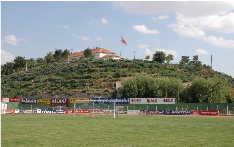
Figür-8. Kalehöyük Genel Görünüm