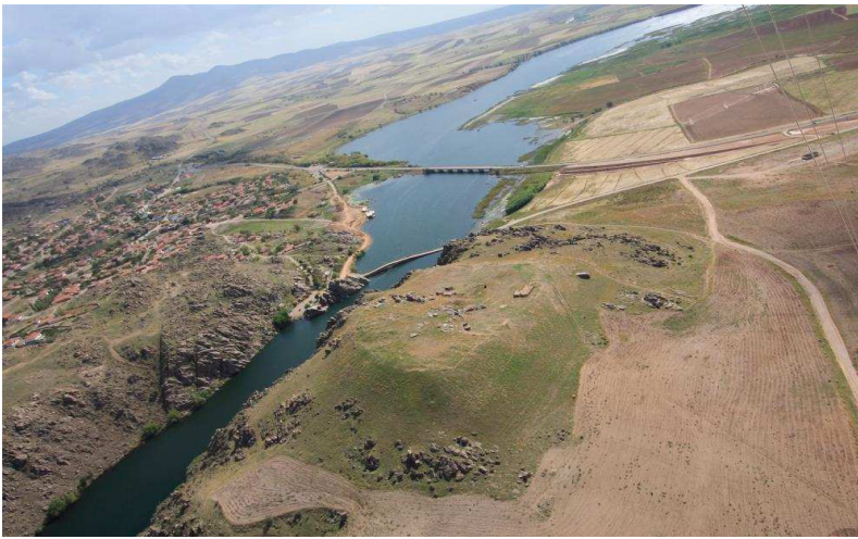
Figür-5. Büklükale Genel Görünüm