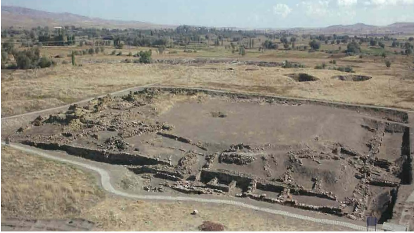
Figür-3. Kültepe, Warşama Sarayı (Kulakođlu, 2011).