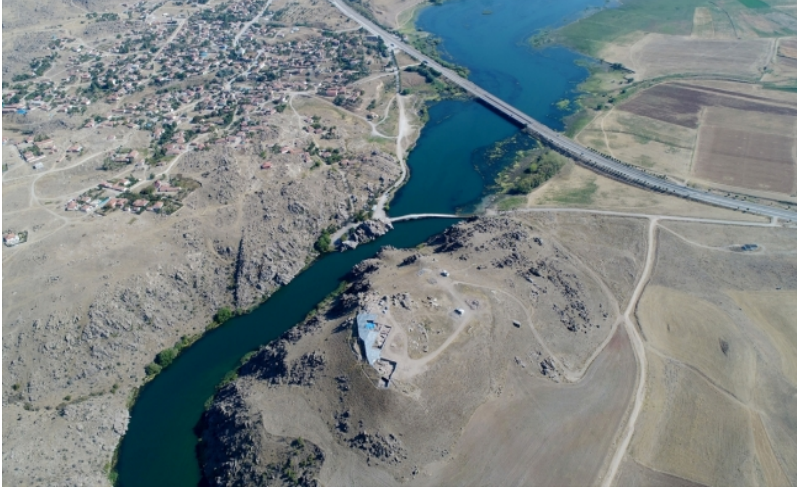
Figür-6. Büklükale Genel Görünüm ( https://www.kulturportali.gov.tr/turkiye/kirikkale/kulturenvanteri/buklukale )