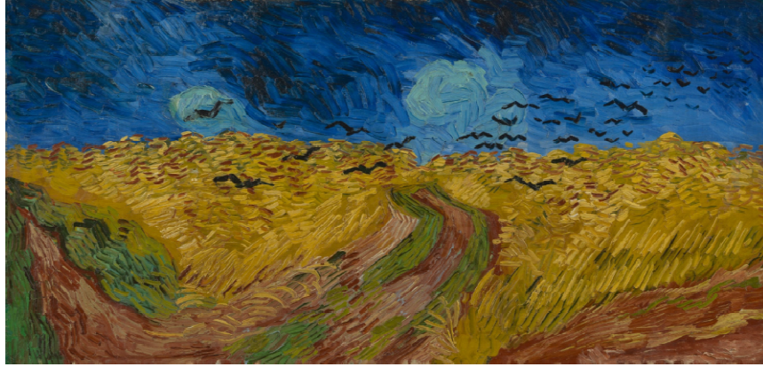
Resim 5: Vincent Van Gogh, Wheat Field with Crows (Buğday Tarlası ve Kargalar), Tuval Üzerine Yağlıboya, 50,5x103 cm, 1890, Van Gogh Müzesi, Amsterdam

Vincent van Gogh’un Wheat Field with Crows (Buğday Tarlası ve Kargalar) isimli eseri (Bkz. Resim 5), yaşadığı melankoli ve yalnızlığı yansıtmıştır. Sanatçı içinde bulunduğu yalnızlığı, düş kırıklıklarını, resimdeki sonu belli olmayan devasa alana yansıtmıştır. Buğday tarlasının üzerinde kanat çırpın kargalar, ölümün kasvetini yansıtırcasına resme gerilim katmıştır. Nereye vardığı belli olmayan tarlaların görünümü, sert bir rüzgârın devirmiş gibi görünen buğday başakları ve kasvetli atmosfer, ressamın hayata karşı duyduğu melankolik düşünceyi dile getirir niteliktedir.