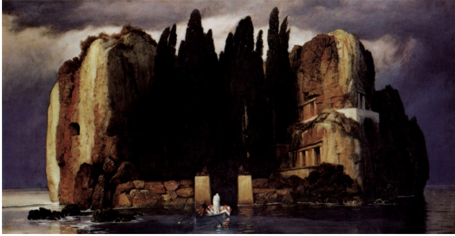
Resim 7: Arnold Böcklin, Ölüler Adası (The Isle of the Dead), Arnold Böcklin, Tahta Üzerine Yağlıboya, 73,7 x 121,9 cm, 1880, Metropolitan Sanat Müzesi, New York.

Resim sanatında melankoli ve yalnızlık temasını yansıtan bir diğer resim, Arnold Böcklin’in Ölüler Adası isimli eseridir (Bkz. Resim 7). Eserde yüksek kayalıklarla kaplı ve kayalıklara oranla biraz daha yüksek olan ağaçların olduğu adaya doğru ilerleyen bir kayık görünmektedir. Eserdeki karanlık atmosferi bulutların griliği destekler niteliktedir. Issızlığa doğru yapılan bir yolculuğun yansıdığı resimde melankolinin ve yalnızlığın etkili bir biçimde yansması ile karşılaşmaktadır.