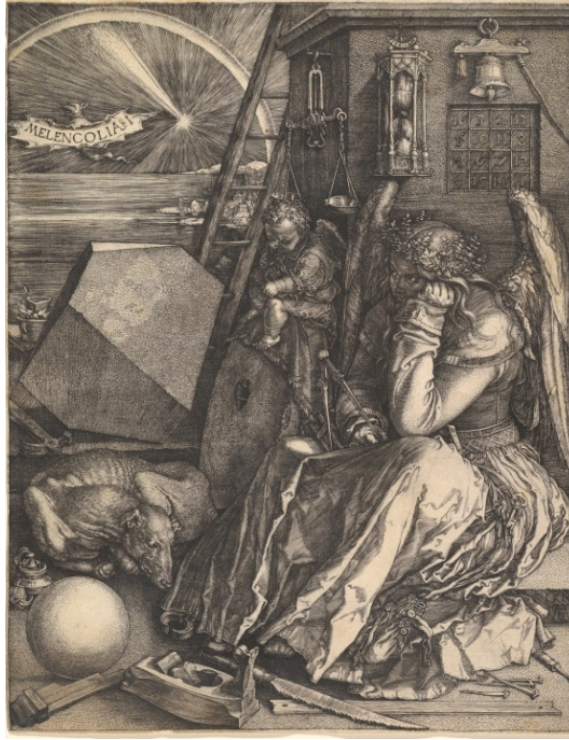
Resim 1: Albrecht Dürer, Melancholia I, 24 x 18,6 cm, 1514, Berlin Devlet Müzesi.

Melankoli ve kavramı resim sanatı içerisinde oldukça geniş bir yere sahip kavramlar arasında gelmiştir. Antik çağdan bugüne, farklı bakış açıları ile ifade edilen, yorumlanan melankoli, sanatçıların eserlerine yansırken bu yansıyış şiir, destan gibi edebi ürünlerden beslenirken toplumun geleneklerinden, efsanelerinden de beslenmiştir. Tolumun yaşayış biçimi onların sanat anlayışlarında değişiklikler meydana getirirken, ruhsal açıdan da etkilemiştir. Resimde melankoli kavramı, “zihnin pasif konumda oluşu göz önünde bulundurularak, hareketsiz duran, düşünen figürlerle tasvir edilmiştir” (Erdok, 2006, 26’ dan aktaran Anbarpınar, 2012, 35-36). Resim sanatında çoğu dönemde eserlere konu edinen melankoli kavramını örnekleme açısından Albrecht Dürer’in Melancholia1 adlı eseri (Bkz. Resim 1), sözü geçen kavramı içinde barındıran önemli bir eser olmuştur.