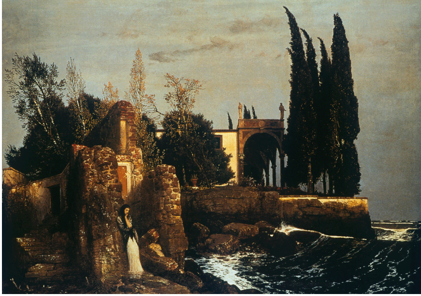
Resim 8: Arnold Böcklin, Deniz Kenarında Villa (Villa byTheSea), 1865, T.Ü.Y.B.,Winterthur Sanat Müzesi, İsviçre, 160 x 110 cm.

“Böcklin İtalyan villalarını ve Toskana manzaralarını kaynak alarak 1858-1880 arasında Deniz Kenarında Villa adlı resmin pek çok versiyonu üzerinde çalıştı. Roma’da kaldığı sıralarda yaptığı 1865 tarihli resimde deniz kenarındaki siyahlı kadın, yükselen kademeler, dalgalı deniz, villanın bahçesindeki heykeller, gökyüzüne yükselen ağaçlar ve gölgede kalan karanlık kısımlar sahnenin dramatik etkisini güçlendiriyor. Rüzgârlı havada denizin dalgasının sahile vuruşu ve ağaçların tepelerindeki sallantı düşünceli kadını huzursuz ediyor gibi. Doğanın yansıtılışı, ışığın etkisi ve kadının duruşu melankolik, ümitsiz ve mistik bir izlenim bırakıyor. Ressam doğa içinde düşünceli, dalgın kadın figürüne sonraki yıllardaki çalışmalarında da yer verir.” (Yılmaz, [15.03.2020])