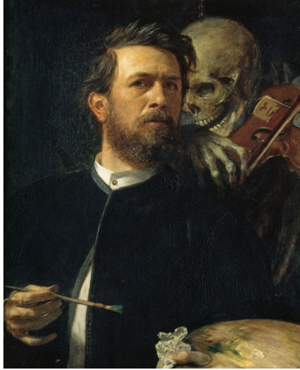
Resim 10: Arnold Böcklin – Keman Çalan Ölümle Otoportre (Self Portrait with Death Playing the Fiddle), Tuval Üzerine Yağlı Boya, 75x61cm, 1872, Berlin, Alte Nationalgalerie, Almanya.

“Elli beş yaşındayken çizdiği, Keman Çalan Ölüm’le kendi portresinde bir elinde palet diğerinde fırça tutarken ölümün soluğunu da ensesinde hissetmekteydi. Hemen arkasında bulunan iskeletten haberdardır bakışları dikkatli bakılınca. Çünkü o, ölümün ta kendisidir ve Böcklin’i hep takip etmektedir. Koyu renkler, arka planın belirsizliği onun ölümle kurduğu ilişkiyi, dışsal ve uzak bir kavram yerine, daha ziyade sadece kendi içinde yaşadığı ve yaşattığı bir metafor olarak duyumsadığını gösteriyor bizlere. 11 çocuğundan beşini bebeklik döneminde koleradan kaybeden ressam için ölümün, bizim algıladığımız nadirliği, yani ötekiliği onda yoktur. Kaotik bir ressamdan ziyade düşünceleriyle içinde bilinmezliğe, ölümden öteye duyulan hınc ve merak taşıyan biriydi o.” (Saray, [15.03.2020]).