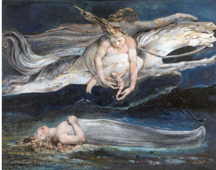
Resim 4: William Blake, Acıma, Kağıt Üzerine Suluboya ve Mürekkep, 54x42 cm. 1795, Tate Gallery, Londra.