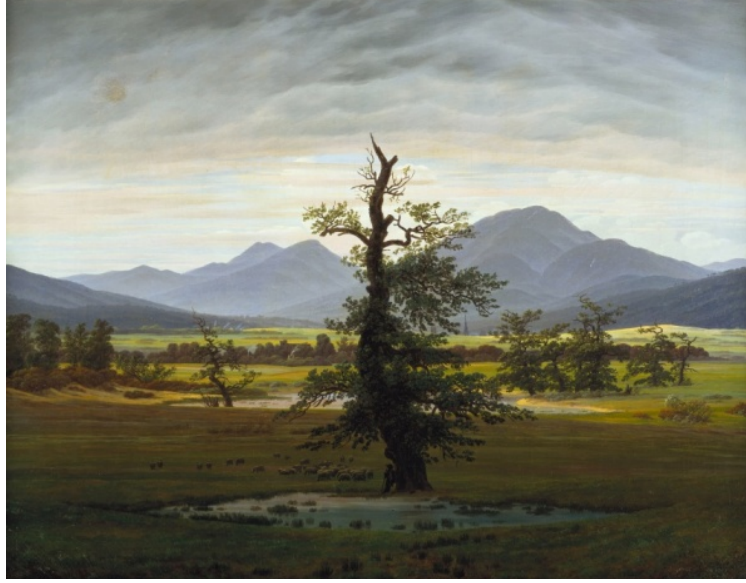
Resim 6. Caspar David Friedrich, Yalnız Ağaç, T.Ü.Y.B. 55x71 cm, 1822, Nationalgalerie, Berlin.

“Bu resmin yüksek bakış noktası, izleyiciyi, büyük meşe ağacının üst yarısına yakın bir yerde havada asılı duruyormuşçasına sabah manzarasının muhteşem bir genel görünüşünü sunuyor. Eski ağacı sahnenin merkezine yerleştirerek, Friedrich, üstü kurumaya başlasa bile ona teatral bir anıtsallık veriyor. (...) Ağacın dramatik etkisi, yüzyıllardan kalma gövdesine dayanan ve sürüsünü izleyen dalgın bir çoban figürü tarafından daha da yükselmektedir, ikincisi görünüşte çakıl taşlarının ölçeğine indirgenmiştir.” (Rewald, 2001, 38)