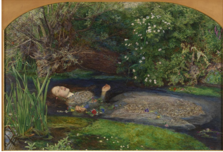
Resim 3: John Everet Millais, Ophelia, T.Ü.Y.B. 76x112 cm, 1851, Tate Galerisi, Londra.