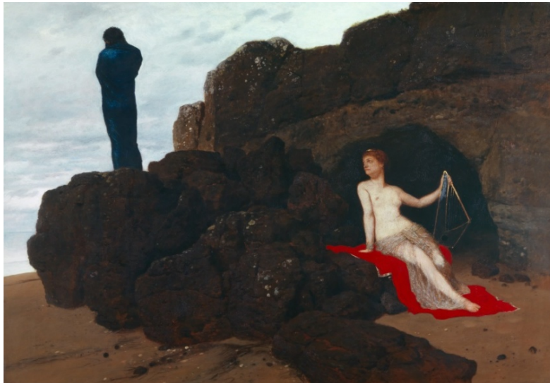
Resim 9: Arnold Böcklin, Odysseus ve Kalypso ( Odysseusand Kalypso) 1883, 104x150 cm, Basel Sanat Müzesi.