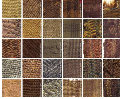
Şekil 9: M.Ö. 10-9 da Hallstatt tuz madenlerinde bulunan çeşitli tekstil ürünleri. Bu tekstil kalıntıları sepet örgüsü, çapraz dimi ve ekoseler olmak üzere farklı renkli iç içe dokunmuş ipliklerden oluşan tekstiller olup, son derece gelişmiş dokuma becerisini gösteren kanıtlardır ( https://spacezilotes.wordpress.com/2012/07/17/an-approach-about-keltoi-c-celtic-clothing-1/ , erişim tarihi: 10.08.2020).

Ayrıca, bu iç Asya bölgelerinin en az birinden tekstiller şaşırtıcı bir şekilde, Avrupa'nın eski kolay çürüyen tekstillerinin iyi hayatta kaldığı tek yer, Yukarı Avusturya'da Hallstatt ve Hallein'deki Salzburg Dönemi tuz madenlerinde, Salzburg'un yukarısındaki Alplerde bulunan kendine has ekose dimi kumaşlara benziyordu. Avusturya kökenli ekose dimi, Keltlerin ataları tarafından dokunmuştu.