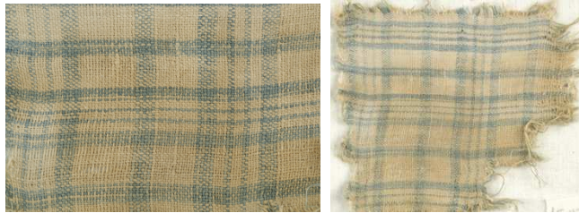
Şekil 6: Düz Kumaş Dokuma Parçası, MS 5-6. yüzyıl Keten, (10,2 x 10,8 cm). Brooklyn Müzesi, Env. No: 15.474f, https://www.brooklynmuseum.org/opencollection/objects/9220 , erişim tarihi: 10.08.2020).