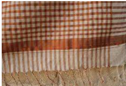
Şekil 22: Şanlıurfa Çülhası (Şakkalı), ( https://sanliurfa.ktb.gov.tr/Eklenti/22219,culha.pdf?0 , erişim tarihi: 10.08.2020)