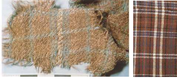
Şekil 11: Hami yakınlarında Kızılçoka'da M.Ö. 1200- 700 yılları arasına tarihlenen bir ceset üzerinde bulunan ekose yünlü dimi: açık kahverengi ve açık mavi ve beyaz çizgilerle dokunmuştur. Bu dimi ekose yeniden üretilmiştir ( https://tr.pinterest.com/pin/508766089139628440/ , erişim tarihi: 10.08.2020).

Hami ekoseleri (plaid) altı renge sahip olabilir, eski Hallstatt eşyaları yerine modern İskoçya'dakine benzeyen kumaşlardaki ekose ve dimi düzenli kombinasyonları ve genişleyip daralan kareler tüm bunların tesadüfi olmadığını göstermektedir.