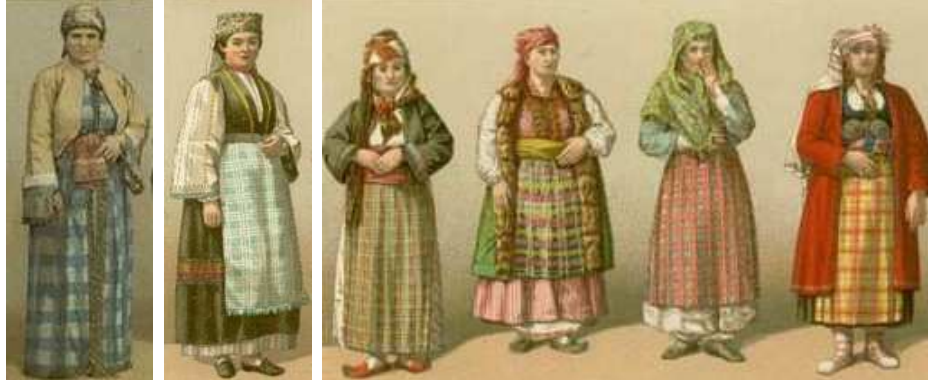
Şekil 18: Osmanlı dönemi halkın giydiği ekose desenli giysi örnekleri