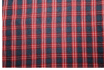
Şekil 21: Tokat (Zengin) Alacası (Şalvarlık) (Eraslan ve Atalayer, 2013, 256-257).