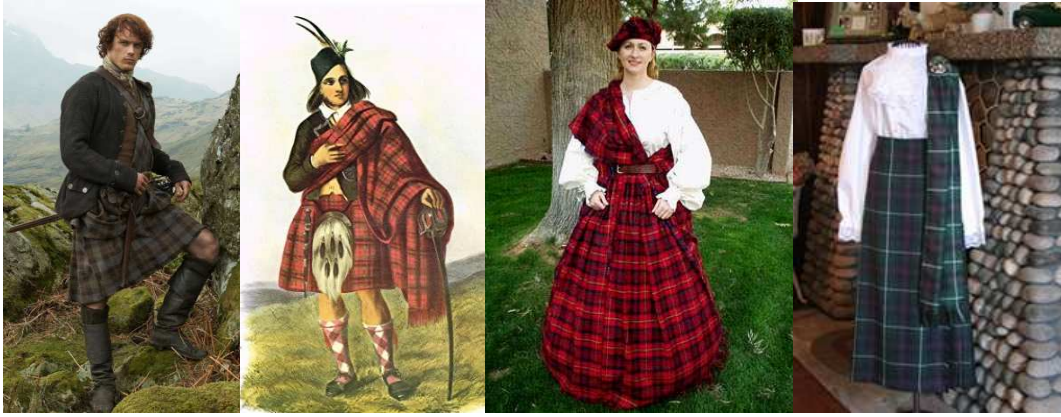
Şekil 15: İskoçya da erkeklerin giydiği geleneksel tartan, kilt ve geleneksel İskoç kadın giysi örnekleri

İskoçya'daki kadınların giydiği ekose eltekler ise erkeklerin eteklerinin tersine uzun olur. Aksesuar olarak da omuzlarına attıkları ekose desenli şallar kullanılır.