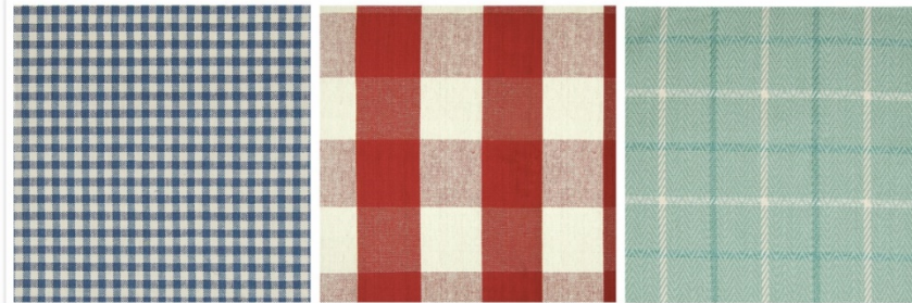
Şekil 4: Mavi ve beyaz şemsiye Check deseni A9736 mavi kuş, kırmızı ve beyaz Buffalo Check deseni A8588 istakoz, pencere camı Check deseni A9748 Deniz rengi https://www.greenhousefabrics.com/https%3A//www.greenhousefabrics.com/blog/tartan-vs-plaid-vs-check , 30.06.2020)