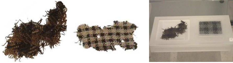
Şekil 7: Falkirk Tartan orijinal parça ve reproduksiyonu ( https://www.scotshistoryonline.co.uk/tartan-history.html , erişim tarihi: 28.07.2020), ( https://www.flickr.com/photos/freewaydiva/1891862665/ , erişim tarihi: 28.07.2020), ( https://www.scotsconnection.com/tartan_story/falkirktartan.jpg , erişim tarihi: 28.07.2020).

Tartanın kesin kökenleri bilinmemekle birlikte, Falkirk'te, MS üçüncü yüzyıldan kalma bir parça (Şekil: 5), İskoçya'da erken bir dönemde basit yünlü kumaşların bulunduğunu göstermektedir. Şu anda tartan ile ilişkili olan karmaşık model, 16. yüzyıla kadar İskoçya'da yoktu.