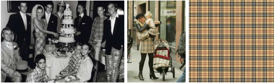
Şekil 28: Kate Moss, İlkbahar / Yaz 2000 Burberry kampanyasında pasta kesti (sol). Daniella Westbrook, tepeden tırnağa Burberry kıyafetiyle (sağ) ( https://www.grailed.com/drycleanonly/history-of-the-burberry-check , erişim tarihi: 11.08.2020)

İngiliz Burberry markasının popüler kültürdeki vizyonu, dünyanın en tanınmış modellerinden biri olan ikonik Burberry checki (çek) ile ayrılmaz bir şekilde bağlantılıdır. Burberry, onlarca yıldır İngiliz lüksünün bir sembolü olmuştu, ancak birdenbire çek, genç işçi sınıfının ve futbol holiganlarının favorisi haline gelmişti. Burberry çeki tüm Birleşik Krallık'ta bikiplerde ve ev aletlerinde görülmeye başladı. 1920'lerde Burberry, siyah, kırmızı ve beyaz vurgulu bej tabanlı bir İskoç ekose tasarımı olan ikonik çekinin yaratılmasıyla bir sonraki büyük marka atılımını yaptı. Başlangıçta çek yalnızca şirketin paltolarına dikiliyordu. Aslında, çekin kökeninden tasarımın kendi başına bir moda ifadesi haline gelmesi kırk yıldan fazla zaman alacaktı. 1967'de Burberry fular yaratıldı. İngiliz seçkinleri arasında hemen popüler olan Burberry çeki hızla bir statü sembolü haline geldi. 2000 yılında, bütün bir düğünün Burberry çeki ile donatıldığı ünlü Kate Moss Burberry kampanyası, İngiltere ve ABD'de yankı uyandırdı ve bu deseni her yerde yaygın hale getirdi. 2002'de, İngiliz pembe dizi yıldızı Daniella Westbrook'un Burberry kareli mini etek giymiş, Burberry çantalı ve Burberry bebek arabasını iterken çekilen ünlü fotoğrafı İngiliz medyasını kasıp kavurmuştu. Westbrook, küçük kızına bile Burberry ikonu olan check desenli bir etek giydirmişti ( https://www.grailed.com/drycleanonly/history-of-the-burberry-check , erişim tarihi: 11.08.2020)