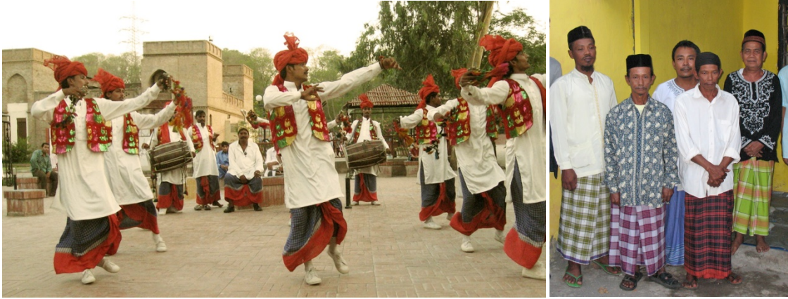
Şekil 17: Lungi'deki Hintli Bhangra dansçıları, Sarong ile (sağda) ( https://en.wikipedia.org/wiki/Sarong , erişim tarihi: 12.08.2020) , Java adasındaki erkekler sarong ile (solda) ( https://tr.wikipedia.org/w/index.php?title=Sarong&action=edit , erişim tarihi: 12.08.2020).

Sarong (Malaya peştemâli): Bir sarong veya Sarung; "Endonezce ve Malayca "ip" veya "kılıf" anlamına gelir), Malaya peştemâli veya sarung, Hint alt kıtasında, Güneydoğu Asya'da, Sri Lanka'da, Arap Yarımadası'nda, Afrika'da, Doğu Afrika'da ve birçok Pasifik adasında giyilen, genellikle bele sarılan büyük, uzun bir kumaştır. Filipince olan bu kelimenin dilimizdeki karşılığı Malaya peştemâli'dir. Kumaş genellikle ekose dokuma (plaid) veya kareli (çek) desenlere sahiptir, batik veya ikat boyama yoluyla parlak bir şekilde renklendirilebilir. Birçok modern sarong, dokuma ekose denin üzerine genellikle hayvanları veya bitkileri betimleyen baskılı tasarımlara sahiptir. Dünyanın farklı yerlerinde, özellikle Hindistan yarımadasındaki lungi ve Arap Yarımadası'ndaki izaar olmak üzere farklı türlerde saronglar giyilir ( https://en.wikipedia.org/wiki/Sarong , erişim tarihi: 12.08.2020). Bu kumaşlara Tahiti ve Hawaii'de pareo, Endonezya, Tayland, Malezya ve Filipinler'de sarong denir. Hindistan'da benzer bir giysi sri, Afrika'da kanga olarak bilinir. Antik çağda Roma ve Yunanistan'da toga, Anadolu'da peştamal, olarak görülür. İpek, keten, pamuk veya sentetik kumaşlardan yapılmaktadır. Sarong üzerine batik yapılması, Endonezya kültüründe yüzyıllardır çok önemli bir yere sahiptir. Genellikle 2.38x1 metre boyutlarında üretilirler ( https://tr.wikipedia.org/w/index.php?title=Sarong&action=edit , erişim tarihi: 12.08.2020).