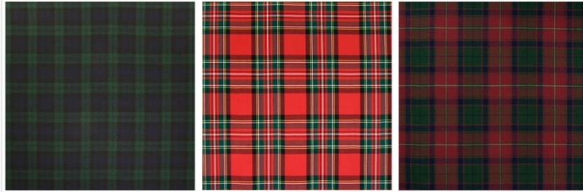
Şekil 1: Siyah Saat Tartan B6378 Yeşilbaş, Stewart Kraliyet Tartan B5012 Ekose, Klasik Tartan B5028 Chianti ( https://www.greenhousefabrics.com/https%3A//www.greenhousefabrics.com/blog/tartan-vs-plaid-vs-check , 30.06.2020)