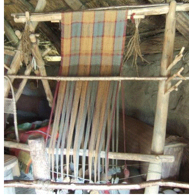
Şekil 12: İlk çağlarda İskoç ekose dokuması , ( http://www.ligonierhighlandgames.org/2021-scottish-weaving.html , erişim tarihi: 28.07.2020).

Birçok tarihçi, ekose (plaid ve tartanlar) fikrinin on yedinci yüzyılda İskoçya için nispeten yeni olduğunu varsayıyordu. Arkeoloji farklı bir hikâye anlatmaktadır. Keltler en az üç bin yıldır ekose dimi dokumaktaydılar” ( http://www.tartansauthority.com/tartan/the-birth-of-tartan/ , erişim tarihi: 27.07.2020).