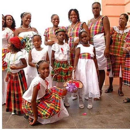
Şekil 16: Dominik Ulusal giysisi ve kumaşı Madras, (çubuklu ve ekoseli kumaş) https://tr.pinterest.com/pin/172403491960259204/ , erişim tarihi: 11.08.2020

Sarong (Malaya peştemâli): Bir sarong veya Sarung; "Endonezce ve Malayca "ip" veya "kılıf" anlamına gelir), Malaya peştemâli veya sarung, Hint alt kıtasında, Güneydoğu Asya'da, Sri Lanka'da, Arap Yarımadası'nda, Afrika'da, Doğu Afrika'da ve birçok Pasifik adasında giyilen, genellikle bele sarılan büyük, uzun bir kumaştır. Filipince olan bu kelimenin dilimizdeki karşılığı Malaya peştemâli'dir. Kumaş genellikle ekose dokuma (plaid) veya kareli (çek) desenlere sahiptir, batik veya ikat boyama yoluyla parlak bir şekilde renklendirilebilir. Birçok modern sarong, dokuma ekose denin üzerine genellikle hayvanları veya bitkileri betimleyen baskılı tasarımlara sahiptir. Dünyanın farklı yerlerinde, özellikle Hindistan yarımadasındaki lungi ve Arap Yarımadası'ndaki izaar olmak üzere farklı türlerde saronglar giyilir ( https://en.wikipedia.org/wiki/Sarong , erişim tarihi: 12.08.2020). Bu kumaşlara Tahiti ve Hawaii'de pareo, Endonezya, Tayland, Malezya ve Filipinler'de sarong denir. Hindistan'da benzer bir giysi sri, Afrika'da kanga olarak bilinir. Antik çağda Roma ve Yunanistan'da toga, Anadolu'da peştamal, olarak görülür. İpek, keten, pamuk veya sentetik kumaşlardan yapılmaktadır. Sarong üzerine batik yapılması, Endonezya kültüründe yüzyıllardır çok önemli bir yere sahiptir. Genellikle 2.38x1 metre boyutlarında üretilirler ( https://tr.wikipedia.org/w/index.php?title=Sarong&action=edit , erişim tarihi: 12.08.2020).