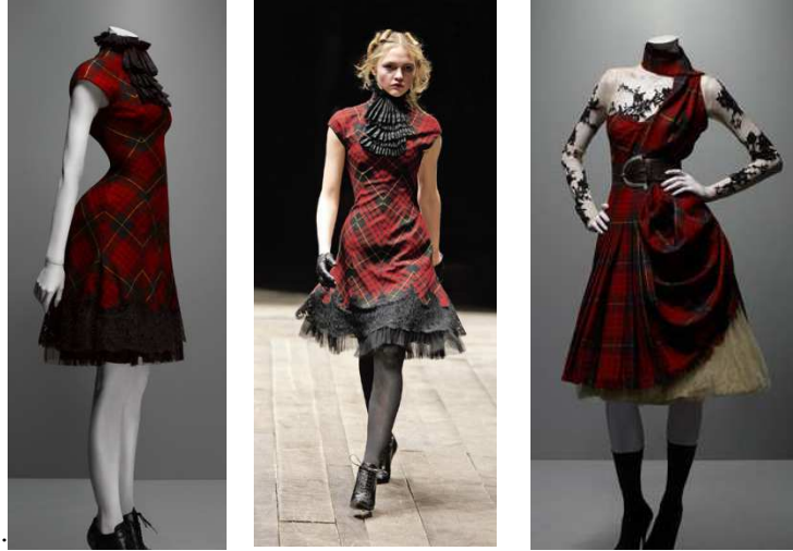
Şekil 26: Alexander McQueen, Culloden'in dulları, Sonbahar / Kış 2006-7 Koleksiyonundan bir giysi.

Alexander McQueen , tartan kumaş ile oluşturduğu koleksiyonunda Widows of Culloden'da (Culloden Dulları, 2006-7 sonbahar/kış), kanlı Culloden savaşında sona eren Jacobite İsyanı'na ve II. Dünya Savaşı gibi savaşlara atıfta bulunmuştur. Tartan kumaşın üzerine bir dizi couture teknikleri kullanmıştır. Koleksiyonda, geleneksel dökümlü ve kuşaklı ekose, geleneksel İskoç elbisesinin her varyasyonu yorumlanmıştır. Kısaltılmış İskoç eteği, İskoçya'nın geleneksel elbisesinin nasıl metalaştırıldığını ve moda olarak İngilizleştirildiğini ortaya koymak içindir. Aynı koleksiyonda ekose kumaşıyla birleştirerek sunduğu hareketli Viktorya dönemi balo elbiseleri, 1940'ların takım elbiseleri, günlük elbiseler ve pantolon takımları da koleksiyonun diğer parçalarıdır.