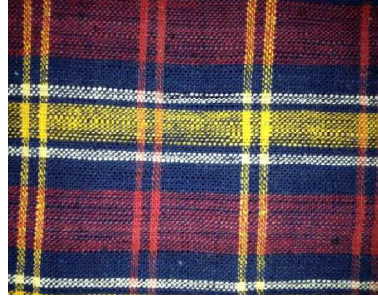
Şekil 20: Seben (BOLU) Alacası (Korkutata, 2017, 137).

Eskiden iç giyimde tefrişte ve çeşitli ihtiyaçlarda kullanılan alacalar, günümüze kadar azalarak da olsa dokunmaya devam etmiştir. Bursa, Halep, Manisa illeri alaca dokumaları ile meşhurmuş, bugün Buldan, Arapkir ve Gaziantep’te eski örnekler göre dokunmaktadır. Eskiden alacaların ipekle dokunduğuna dair bazı resmi kayıtlarda bulunmaktadır (İmer, 2001: 14), (Balkanal ve Sökmen, 2017, 241).