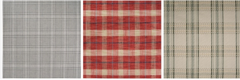
Şekil 3: Glen Plaid veya Galler Prensi Plaid B4923 Grafite, Plaid Dokuma B2100 Pompeii, Plaid Dokuma B1994 Kalay rengi plaid dokuma ( https://www.greenhousefabrics.com/https%3A//www.greenhousefabrics.com/blog/tartan-vs-plaid-vs-check , 30.06.2020)

Bugün, Plaid terimi geleneksel tartan tasarımlarından esinlenen kalıpları ifade eder ve tartan terimi artık bir tür ekose anlamına gelir. "Plaid", desenler otantik tartanlardan esinlenen kumaşları yeniden yaratan İngiliz ve Amerikalı tekstil üreticileri arasında popüler hale geldiğinde "tartan" ın yerini almıştır. Kareli, iki veya daha fazla renkte çapraz yatay ve dikey bantlardan oluşur. Geleneksel tartanlar ve diğer ekose türleri arasındaki ana fark, desenin tekrarıyla ilgilidir. Kareli olarak, dikey şeridin modelinin bir tartan modeli gibi yatay şeridin modeliyle eşleşmesi gerekmez. Plaidler (Ekoseler) birçok bant genişliğine, tekrara ve/veya renk varyasyonuna sahiptir.