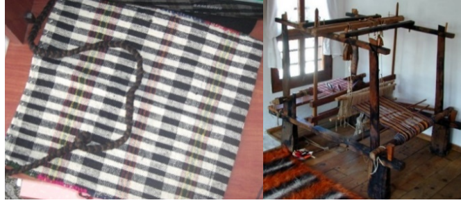
Şekil 23: Biga Pomak dokuması torba ve Pomak dokuma tezgâhı