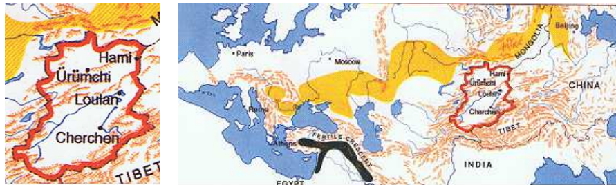
Şekil 8: Ürümçi Mumyalarının bulunduğu bölge, ( http://www.tartansauthority.com/tartan/the-birth-of-tartan/ erişim tarihi: 28.07.2020).