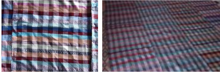
Şekil 24: 3 ayrı parça halinde dokunup birleştirilmiş pamuklu savan. 2004 yılında Gildirli köyünde dokunmuştur. Ölçüleri: 2m x 3m = 6 metre 2 . Savan dokumalarını genelde 6 metre 2 olarak planlanıp 50 cm' lik enden 4 adet ve 3 metre boy olarak birleştirilmiştir (Alpat, 2016, 463).

Adana Tarsus Savan ekose kumaşlarda desenleme olarak hem fantezi hem de blok ekose yüzey düzenleme teknikleri kullanılmaktadır (Eraslan ve Atalayer, 2013, 67). Eskiden paltoluk, pantolonluk, şalvarlık, göynek denilen içlik, çulfalık, seccade ya da namazlık, savan ve çuval dokumaları olarak yapılmaktaydı (Alpat, 2016, 464)