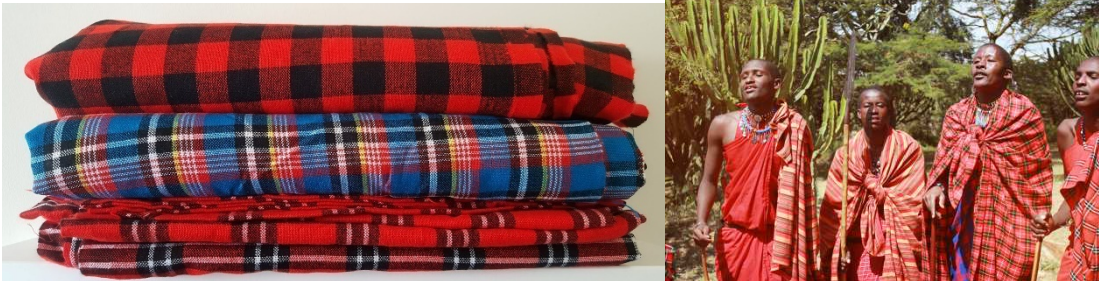
Şekil 14: Maasai kimliği genellikle renkli boncuklu kolyeler, ellerinde demir bir sopa ve kırmızı ekose şuka kumaşla tanınır ( https://www.gadventures.co.uk/blog/story-behind-maasais-shuka-cloth/ , erişim tarihi: 11.08.2020).