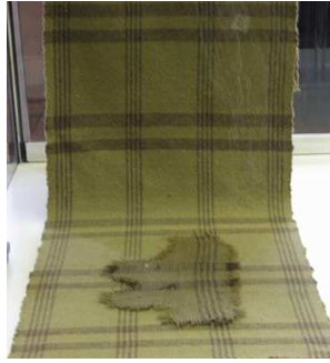
Şekil 10: Halihazırda Avusturya, Viyana Naturhistorisches Müzesinde bulunan MÖ 10-9. Yüzyıldaki Hallstatt antik tuz madeninden ele geçen kahverengi çizgili yünlü kumaş ( https://spacezilotes.wordpress.com/2012/07/17/an-approach-about-keltoi-c-celtic-clothing-1/ , erişim tarihi: 10.08.2020).

Parlak renkli tekstiller hala çok yumuşaktı. Bir ya da iki yüz yıl önceki kumaşlara benziyordu, bu parçalardan birisi üç bin yıl önce dokunmuştu.