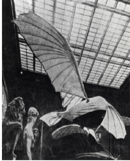
Resim 4: Letatlin

Tatlin 'nin tasarladığı 3. Enternasyonel anıtın özgürlük ütopyası olarak komünizme ve dünya halklarının birlik beraberliğine adandığını söyleyebiliriz. Tatlin 'inin bir diğer ünlü eseri olan Letatlin 3 gibi bir hayal dünyasıdır. Anıt Tatlin'nin deyişiyle bir mimarlık ve heykel sentezi İlya Ehrenburg'a göre de "yeni mimarlığın başlangıcıdır."