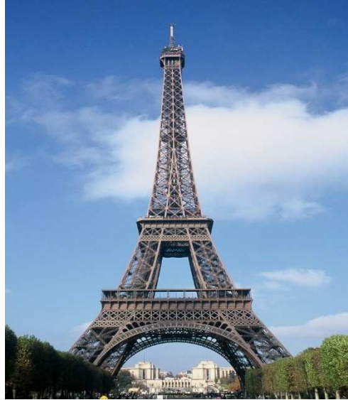
Resim 6: Eyfel Kulesi

Tüm bu bilgiler ışığında, 400 m yüksekliğinde yapılması düşünülen Tatlin'in 3. Enternasyonel anıtı 300 metre yüksekliğinde inşa edilen ve kapitalizmin göstergesi olarak kabul edilen Eyfel Kulesi'ne bir yanıt olarak dikilmesi ve komünizmin simgesi olması planlanmıştır.