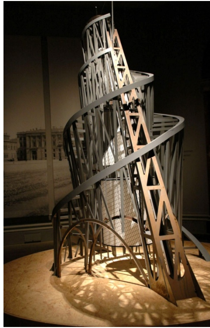
Resim 2

Anıt olarak tasarlanan projede form birbiri ile çatışma halindeki asimetric iki eksenden oluşmaktadır. Anıt projesinin dış çerçevesini oluşturduğu söylenebilecek olan spiraller, her dönüşünde yatay giriş olarak tanımlanabilecek eğik çizgi ile çakışmalarından dolayı kesintiye uğramaktadır. Ana gövdeyi saran ve giderek araları sıklaşan spiraller eğimli duran ve merdiveni andıran taşıyıcı üzerinden geçerek çizgisel hareketlerini aynı noktaya ulaştırmaktadırlar. Eğimli ve sarmal düzenle oluşturulan bu imge, birbirinden farklı iki eksenin aksayan ve çatışan dinamizmiyle yüklüdür. Kuleyi çevreleyen kompozisyon da spiral hareketlerin kullanılması proje kompozisyonunu zenginleştiren en önemli unsurdur.