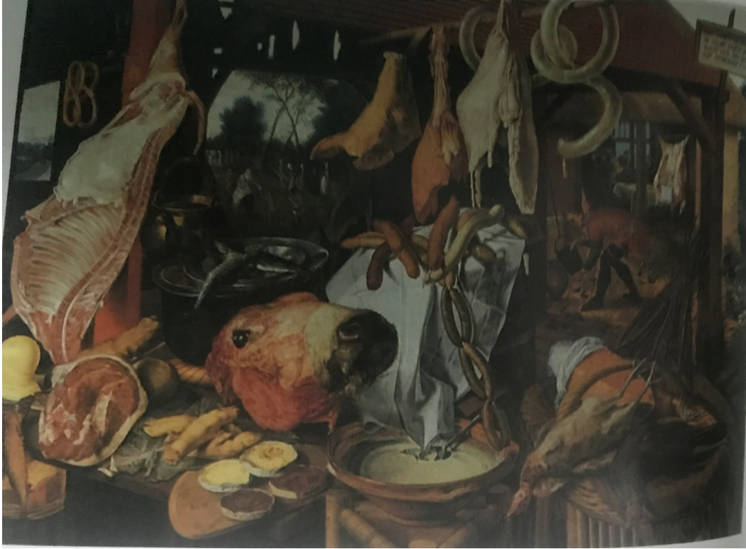
Resim 4: Leppert, s.181, Pieter Aertsen (1505/1509-1575) Et Dükkanı (1551)