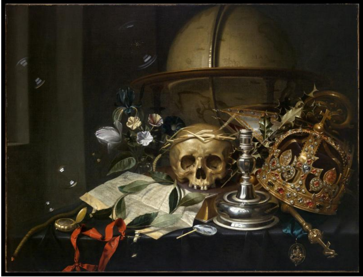
Resim 3: Hendrick Andriessen, Vanitas Natürmort, Flaman (1607-1655), CA. 1650