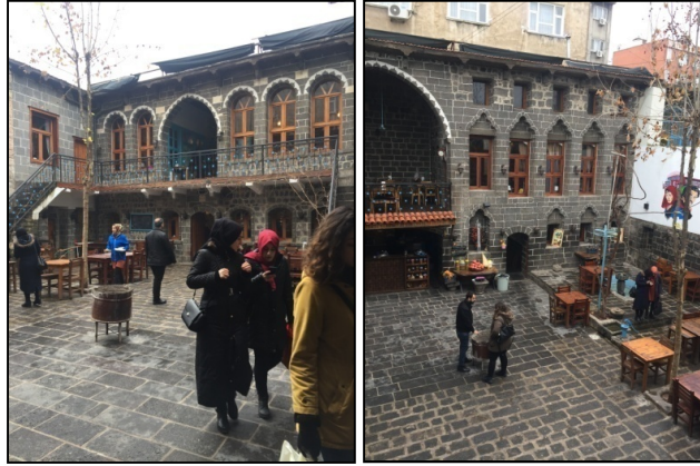
Şekil 8-9: 2 nolu yapının yeni kullanımıyla oluşturulan oturma alanları ve avlu cephesi

2 nolu yapı Cevat Paşa Mahallesi, Doğru Sokak'ta yer almaktadır. Kuzey, güney ve doğudaki üç kanatlı evin girişi güneydeki aralıktan sağlanmaktadır. İki katlı yapının kuzey kanadında, zemin katta bir oda, üst katta bir eyvan ve iki oda yer almaktadır. Doğu kanadın zemin katında bir eyvan, dört oda ile üst katında üç oda bulunmaktadır. Güney kanadın zemin katında bir eyvan ve bir oda, üst katında bir eyvan ve iki oda yer almaktadır. Yapının batı kanadında da bir oda yer almaktadır. Avlu ile birlikte tüm odalar oturma alanı olarak düzenlenmiştir. Doğu kanadında yer alan oda hela, güneydeki eyvan kasa, oda ise mutfak olarak düzenlenmiştir (Şekil 8,9).