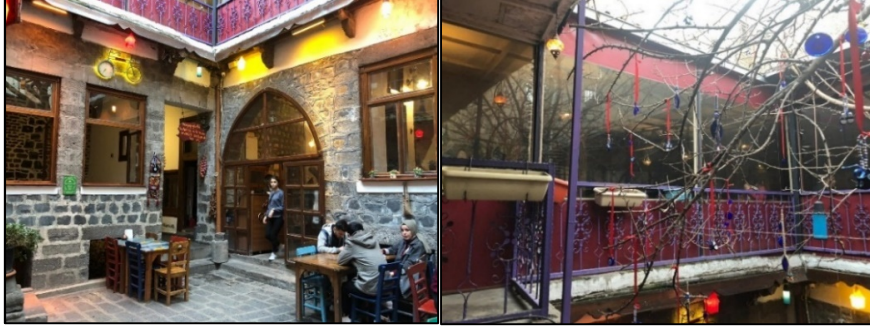
Şekil 12-13: 4 nolu yapının yeni kullanımıyla oluşturulan oturma alanları ve avlu cephesi

Cevat Paşa Mahallesi Yardımcı Sokakta yer alan 4 nolu yapının batıdan ve doğrudan girişi bulunmaktadır. Avlunun kuzeyinde mutfak ve hela, doğusunda büyük bir oda ile girişi mutfaktan sağlanan bodrum ve yeni yapılmış eklenti bir oda bulunmaktadır. Güneyinde ise zemin katta tek açıklıklı eyvan, oda ve bodrum yer almaktadır. Yapının her üç kanadının üstüne eklenti kat yapılmıştır. Mutfak, doğu ve güneydeki odalar, bodrum katın bütünü ve üst kattaki eklenti bölüm oturma alanı olarak düzenlenmiştir. Hela özgün yerinde bulunmakla birlikte tamamen modern malzemeyle yeniden yapılmıştır. Eyvan kapatılarak kasa olarak işlevlendirilmiştir (Şekil 12,13).