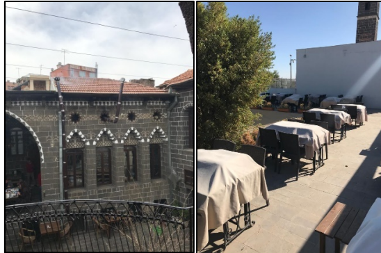
Şekil 37-38: 1 nolu yapı kiremit çatı malzemesi ve yağmur borusu, 7 nolu yapı bazalt plakalar ile döşenmiş dam malzemesi

Geleneksel Diyarbakır evlerinde dam toprak olarak yapılır. Ancak günümüzde kafeterya olarak yeniden işlevlendirilen sekiz yapı gibi birçok damlar betonarme veya kiremit kaplı ahşap çatı ile değiştirilmiştir. 2,3,4,6 ve 8 nolu yapıda dam betonarme olarak değiştirilmiştir. 1 nolu yapı ise betonarme olarak değiştirilen damın üzerine ahşap kırma çatı eklenmiştir. 5 nolu yapının üstü çimento esaslı harç ile betonarme dam sonrası sıvanmıştır. 7 nolu yapıda ise betonarme damın üstü bazalt plakalarla döşenmiştir. Yağmur sularının tahliyesi için ahşap çatı veya bazalt kaplamalı damlarda çötenlerin yerini pvc yağmur boruları almıştır (Tablo2, Şekil 37,38).