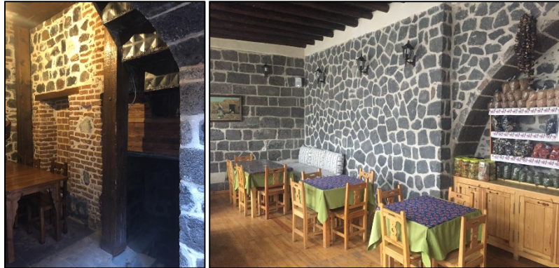
Şekil 32-33: Yapılara eklenen yeni duvarlar (4,8 nolu evler)

Yapılan yanlış müdahalelerden biri de, geniş ve ferah ortamlar oluşturmak için özgün yapının bazı duvarlarının yıkılmasıdır. Bu sorun 3,4,6,8 nolu evde bulunmaktadır (Tablo2, Şekil 32,33).