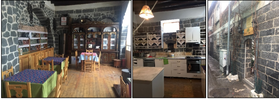
Şekil 20-21-22: 8 nolu yapıya ait sokak cephesi ve iç mekân görünüşleri

Tek kanatlı 8 nolu yapı, Cevat Paşa Mahallesi Çubuklu Sokakta yer almaktadır. Avlu, bodrum ve zemin kattan oluşmaktadır. Yapı özgününde iki oda, eyvan ve heladan oluşsa da, sonradan yapılan değişiklikle birlikte eyvan ve bir oda birleştirilerek genişçe oturma alanı düzenlenmiştir. Diğer oda ise kafeteryaya hizmet amaçlı mutfak birimi olarak kullanılmaktadır. Bodrum depo amaçlı, avlu ise gelen ziyaretçilerin kullanabileceği oturma alanı olarak düzenlenmiştir (Şekil 20,21,22).