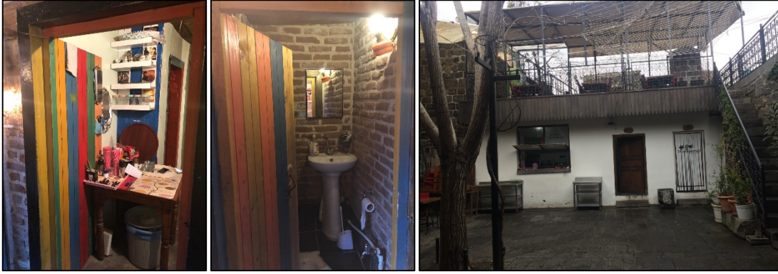
Şekil 29-30-31: Yapılara eklenen yeni birimler (3,4,7 nolu evler)

Bazı evlerde tamamen modern malzemeyle yapılmış oda, kiler, hela gibi yeni birimlerle karşılaşılmaktadır. Bu sorun 2,3,4,6,7,8 nolu evde bulunmaktadır (Tablo2, Şekil 29,30,31).