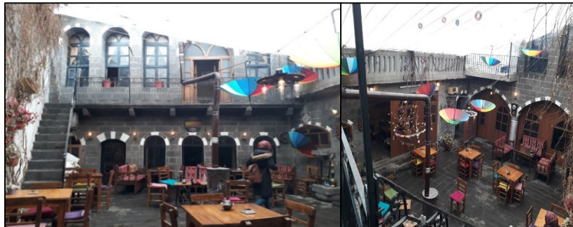
Şekil 16-17: 6 nolu yapının yeni kullanımıyla oluşturulan oturma alanları ve avlu cephesi

6 nolu yapı, Cami Kebir Mahallesi Telgrafhane Sokakta bulunmaktadır. Dört kanatlı yapının batısında komşu eve ait bir mekân, güneyinde iki açıklıklı eyvan ile üst katında odalar yer almaktadır. Doğu kanadında kapatılmış bir giriş, betonarme merdiven, sonradan oluşturulmuş bir eyvan ve küçük bir oda bulunur. İki katlı kuzey kanat, alt katta özgün mutfak ve bir oda, üst katta ise eyvan ve bir odadan oluşmaktadır. Özgün taş merdiven ve gezemek üst kat dolaşımını sağlamaktadır. Evin güney bölümü üzerine çok katlı niteliksiz konut yapılmıştır. Yapıda avlu, eyvan ve odalar oturma alanı olarak düzenlenmiştir. Batıdaki mekân kafeteryanın mutfağı olarak kullanılmaktadır. Doğudaki ana giriş kapısı kapatılmıştır (Şekil 16,17).