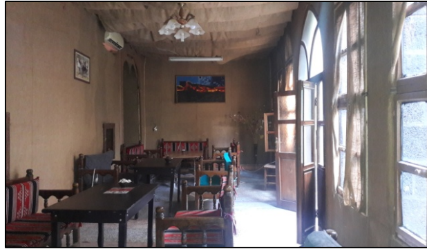
Şekil 41: 6 nolu yapı, odalarda özgüne aykırı malzeme kullanımı

Geleneksel Diyarbakır evlerinde duvarlar kesme taş ya da moloz taş üzeri horasan sıva ve kireç badanadır. Bazı bölme ve taşıyıcı olmayan duvarlar ise kerpiçten yapıldır. Ancak günümüzde çoğunlukla dayanımı az olan kerpiç duvarların yerine tuğla, briket gibi aslına aykırı malzeme kullanılmaktadır. Yer yer özgün duvar yıktırılarak yerine tuğla duvar yapılmış veya duvarlar jütle kaplanmıştır. 6 nolu yapıda bazı duvarlar jütle kaplanmıştır (Tablo 2, Şekil 41).