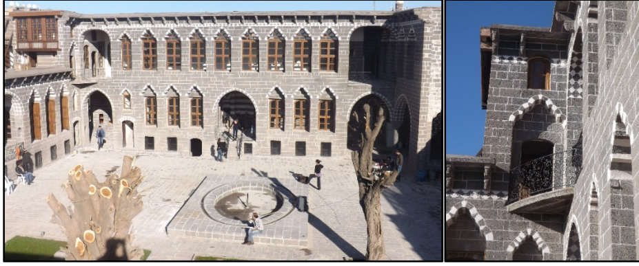
Şekil 1-2: Geleneksel Diyarbakır evlerinden bir örnek (Cemil Paşa Konağı 2014)