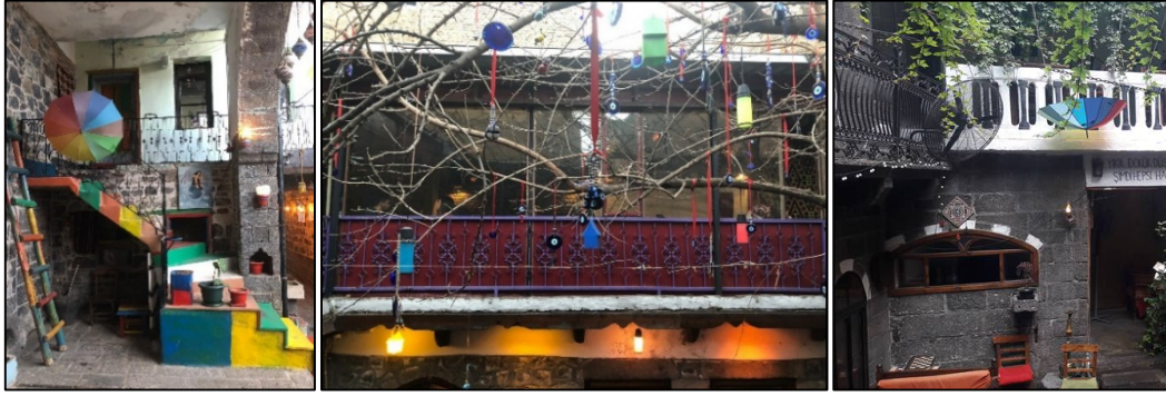
Şekil 23-24-25: Eklenti merdiven, eklenti kat, eklenti korkuluk (3,4,6 nolu evler)

Yeniden işlevlendirilen tarihi evlerde karşılaşılan sorunların en önemlisi mekân artırmak için yapılan eklenti katlardır. Bu sorun 2,3,4,6,7 nolu evde en belirgin biçimde bulunmaktadır. 2 ve 3 nolu evde duvar eklenerek yeni birimler oluşturulmuştur. 4 nolu evde dam tamamen metal ve açılıp kapanabilen pvc esaslı bir malzeme ile kapatılmıştır. 6 nolu evin güney bölümüne niteliksiz bir kat eklenmiştir. 7 nolu evin kuzey bölümüne yeni bir mutfak ve hela eklenmiştir (Tablo2, Şekil 23,24,25).