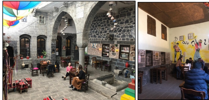
Şekil 10-11: 3 nolu yapının yeni kullanımıyla oluşturulan oturma alanları ve avlu cephesi

Dabanoğlu Mahallesi, Çakmak Sokakta yer alan 3 nolu yapıya güneyden bir aralıkla girilmekte, bunun doğusunda mutfak ve hela bulunmaktadır. Üç kanatlı yapının kuzeyinde büyük pencereleri olan yüksek tavanlı bir oda ve bodrum, güneyinde daha küçük ebatlı bir oda ve bodrum katı mevcuttur. Doğuda havuzu bulunan iki açıklıklı bir eyvan bulunmaktadır. Güneyde betonarme bir merdivenle üst katta yer alan iki odalı ek kata ulaşılmaktadır. Avlu, eyvan, kuzey ve güney kanatta bulunan odalar ile ek kattaki odalardan biri oturma alanı olarak düzenlenmiştir. Mutfak özgün yerinde ve işlevinde kullanılırken, içine kiler amaçlı yeni bir birim eklenmiştir. Kuzeydeki bodrum oturma alanı olarak düzenlenirken, güney cephede bulunan bodrum ve üst kattaki eklenti odalardan biri depo olarak işlevlendirilmiştir (Şekil 10,11).