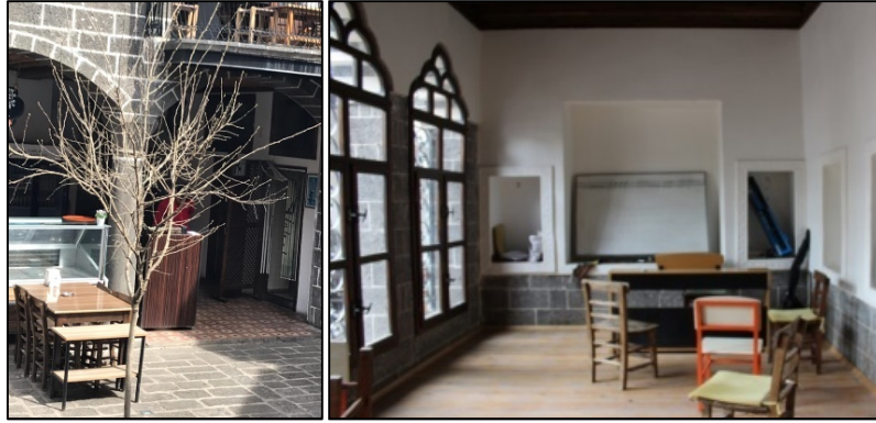
Şekil 35-36: 1 nolu yapı karo mozaik döşeme malzemesi, 5 nolu yapı ahşap döşeme malzemesi

Geleneksel Diyarbakır evlerinde özgün döşeme avlu, eyvan, servis alanları ve bodrum ile zemin kat mekanlarında gözenekli bazalt taş, üst kat odalarında ise sıkıştırılmış horasandır. Ancak günümüzde birçok mekânda pvc, karo mozaik veya seramik türü malzemelerle değiştirilmiştir. 1 ve 6 nolu yapıda helada seramik kullanılmıştır. 1 nolu yapıda mutfak döşemesinde karo mozaik kullanılmıştır. 2,3,4,5,7 ve 8 nolu yapıda ise döşemeler ahşap parke olarak değiştirilmiştir. (Tablo2, Şekil 35,36).