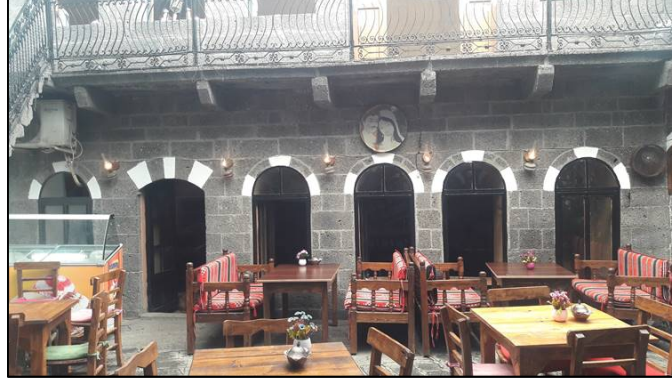
Şekil 34: 6 nolu yapıda metal kapı pencere kayıtları

Geleneksel yapılardaki malzeme sorununu, özgün dokuya aykırı bir şekilde yapılan değişimler oluşturmaktadır. Kapı ve pencere doğramalarında değişim 1,2,3,4,5,6,7 ve 8 nolu yapılarda görülmektedir. 6 nolu yapıda kapı ve pencere kayıtlarının metal olarak değiştirilmiştir (Tablo2, Şekil 34).