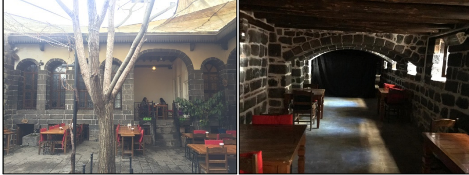
Şekil 18-19: 7 nolu yapının avlu ve bodrum katından görünüş

Sur ilçesi Savaş Mahallesi Dicle Sokakta yer alan 7 nolu iki kanatlı yapı, ortadaki avlu ve onu saran bodrum ve zemin kattan oluşmaktadır. Yeni fonksiyon gereği kuzey bölüme mutfak ve yeni hela eklenmiştir. Güney ve batıda tek açıklıklı bir eyvan ve buradan geçilen odalar bulunmaktadır. Avlu, odalar, eyvanlar ve bodrumun bir bölümü oturma alanı olarak düzenlenmiştir. Bodrumun bir kısmı da depo olarak kullanılmaktadır (Şekil 18,19).