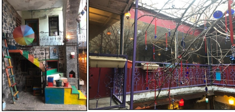
Şekil 39-40: 3-4 nolu yapı betonarme merdiven ve abartılı dekoratif elemanı/renk kullanımı

Geleneksel Diyarbakır evlerinde abartılı dekoratif elemanlar yer almamaktadır. Ancak günümüzde birçok işletmeci kişisel tercihlerine göre düzenleme ve tefriş yapmaktadır. Sade kireç badanalı mekanları yüzeyleri çok sayıda renk kullanarak boyamakta, karmaşık ve geleneksel öğelerin arka plana atıldığı mekanlar ortaya çıkmaktadır. Kafeterya olarak kullanılan sekiz geleneksel evde de bu aykırı uygulamalar görülmektedir (Tablo2, Şekil 39,40).