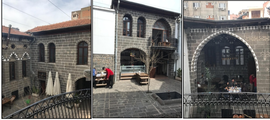
Şekil 5-6-7: 1 nolu yapının yeni kullanımıyla oluşturulan oturma alanları ve avlu cephesi

2 nolu yapı Cevat Paşa Mahallesi, Doğru Sokak'ta yer almaktadır. Kuzey, güney ve doğudaki üç kanatlı evin girişi güneydeki aralıktan sağlanmaktadır. İki katlı yapının kuzey kanadında, zemin katta bir oda, üst katta bir eyvan ve iki oda yer almaktadır. Doğu kanadın zemin katında bir eyvan, dört oda ile üst katında üç oda bulunmaktadır. Güney kanadın zemin katında bir eyvan ve bir oda, üst katında bir eyvan ve iki oda yer almaktadır. Yapının batı kanadında da bir oda yer almaktadır. Avlu ile birlikte tüm odalar oturma alanı olarak düzenlenmiştir. Doğu kanadında yer alan oda hela, güneydeki eyvan kasa, oda ise mutfak olarak düzenlenmiştir (Şekil 8,9).