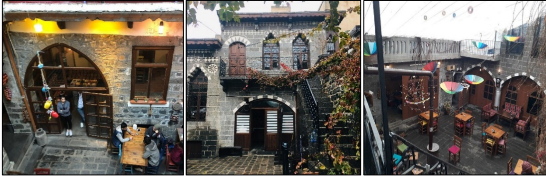
Şekil 26-27-28: Yapılarda eyvanların kapatılması (4,5,6 nolu evler)

Kapalı mekân alanını artırmak için eyvanlar birçok yapıda kapatılmaktadır. Bu sorun 4,5,6,8 nolu evlerde mevcuttur. Kapatılan eyvanlar, 4 nolu evde oturma, geçiş ve hesap ödeme alanı, 5 nolu evde mutfak, 6 nolu evde oturma ve 8 nolu evde oturma ve ürün sergileme alanı olarak kullanılmaktadır (Tablo2, Şekil 26,27,28).