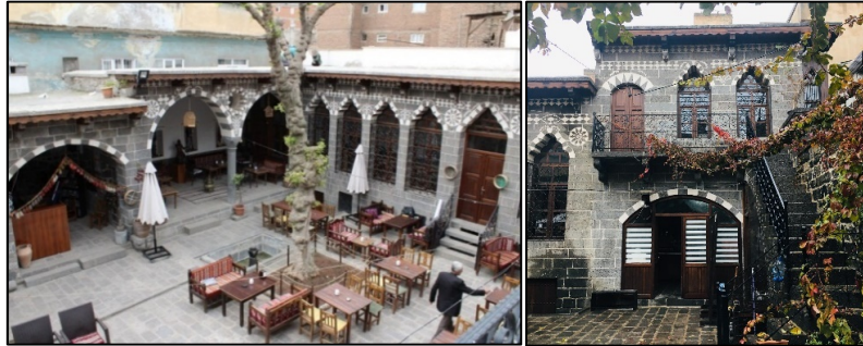
Şekil 14-15: 5 nolu yapının yeni kullanımıyla oluşturulan oturma alanları ve avlu cephesi

5 nolu yapı Ziya Gökalp Mahallesi Gökalp Sokakta yer almaktadır. Yapıda biri müşteri ve ziyaretçi, diğeri mutfak için olmak üzere iki giriş bulunmaktadır. Üç kanatlı yapının kuzey ve batısında odalar ve bodrum kat, güney kanadında ise eyvan, mutfak ve oda bulunmaktadır. Hela yapının batısında yer almaktadır. Günümüzde güney kanattaki mutfak kasa olarak kullanılmaktadır. Kuzey kanatta bulunan eyvan ise kapatılarak mutfak olarak düzenlenmiştir. Üst kat idari alan olarak işlevlendirilirken, diğeri odalar ve batı kanadındaki bodrum, müşteriler için oturma alanı olarak düzenlenmiştir (Şekil 14,15).