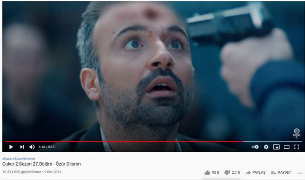
Resim 2: Çukur 2.Sezon 27.Bölüm - Özür Dilerim

9 Nisan 2019 tarihinde YouTube sitesine yüklenen bu video 10 milyondan fazla izleyiciye ulaşmıştır. Sahnenin 92 bin kişi tarafından beğenildiği görülmektedir. Beğenmeyen izleyicilerin sayısı ise 3 binden azdır. İzleyiciler yine bu sahneye de 5 binden fazla yorum eklemişlerdir. İzleyici sayısına oranla bu sahnedeki yorum sayısı daha fazladır (YouTube, Erişim: 08.03.2020).